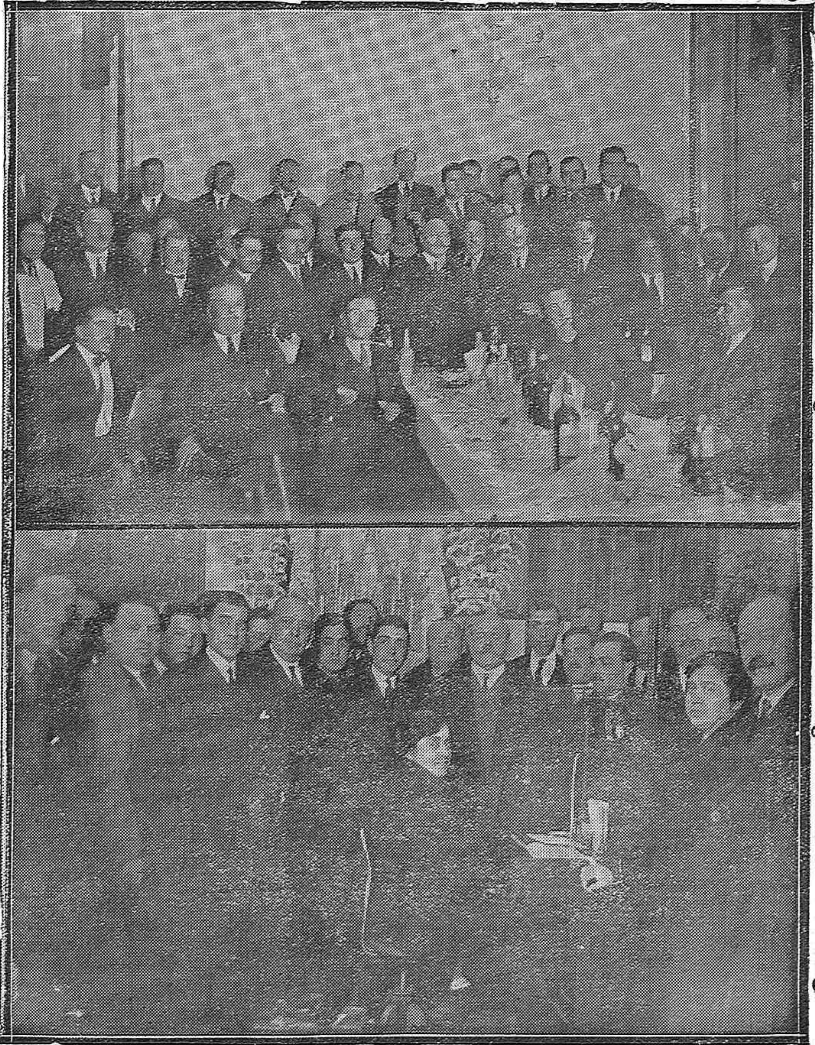
MONTORO.—«Lunch» con que fueron obsequiados por el Ayuntamiento los concurrentes a la inauguración del Teléfono Urbano.—El acto de la inauguración.