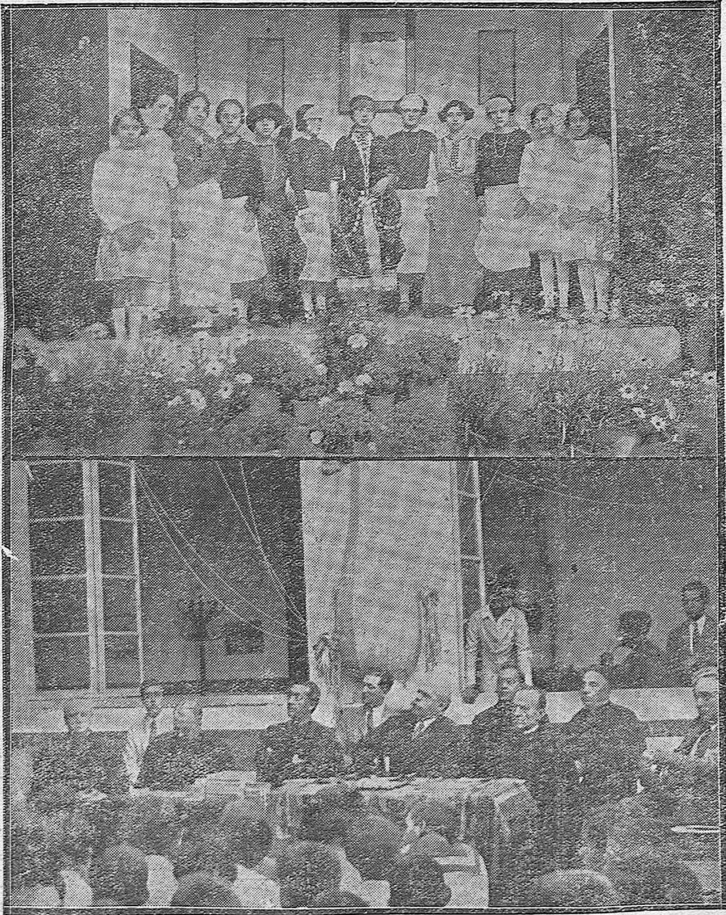
DE LAS PASADAS FIESTAS ESCOLARES.--Distinguidas jóvenes que representaron una función en Jesús Nazareno.--Las autoridades en el Colegio de San Hipólito.