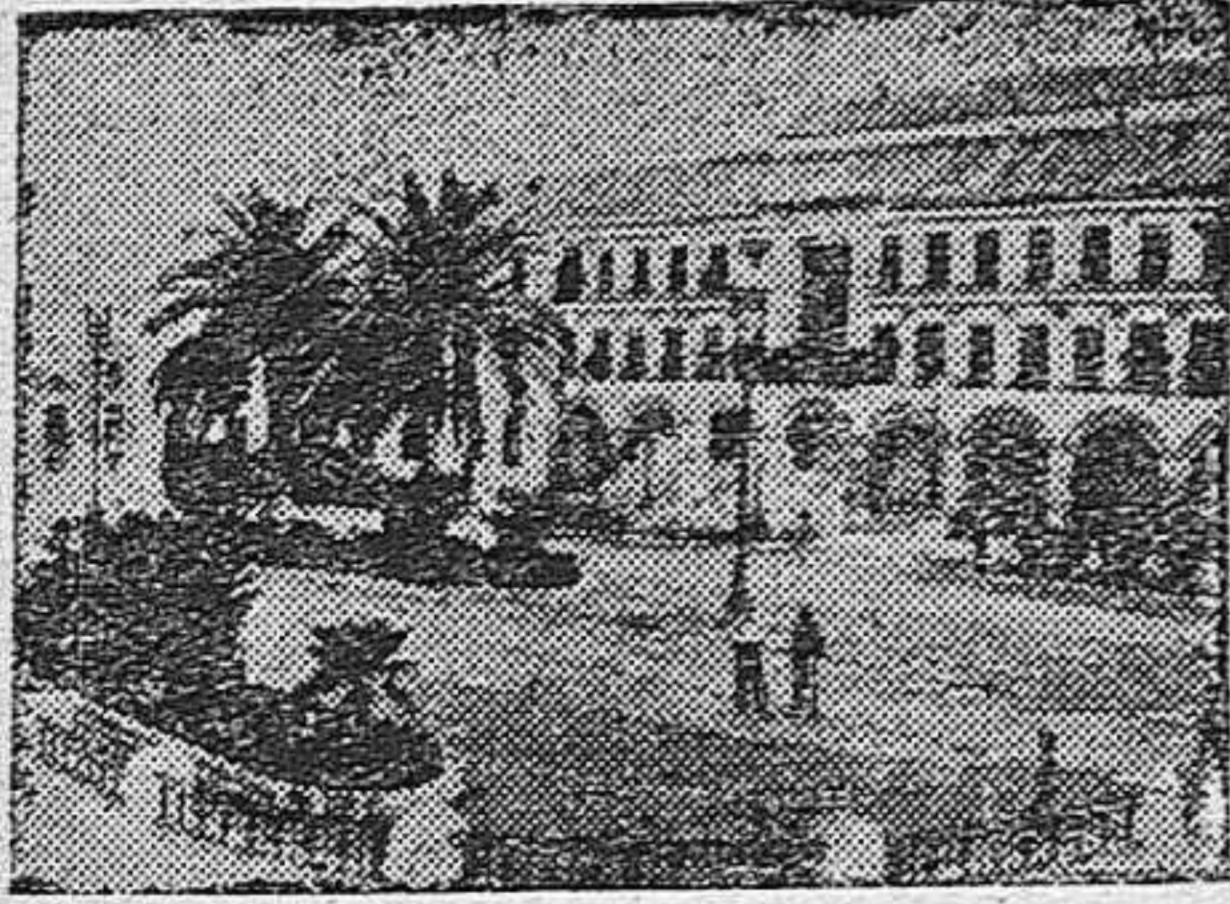
La Plaza del Generalísimo tiene este de- licioso trazado y emplazamiento en lo más tradicional de Baena

Hablamos unos instantes con el mencio- nado alcalde. Después de un sincero elogio para la Corporación que, en tiempos del benemérito español, general Primo de Ri- vera, concertó un empréstito con una En- tidad bancaria para traída de aguas, sanea- miento de la población y para pavimenta- ción de una gran parte de ésta.