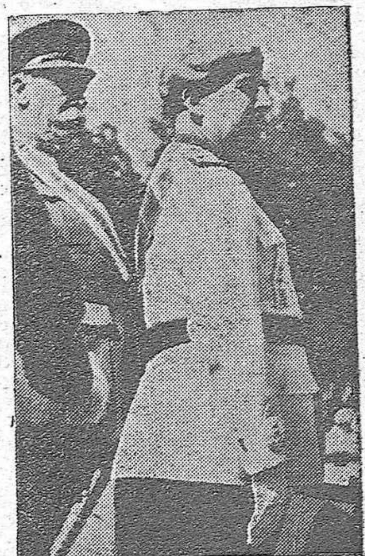
El Caudillo Franco, vistiendo el uniforme de Falange Española Tradicionalista y de las JONS, presencia el grandioso desfile del 18 de Julio en Madrid.