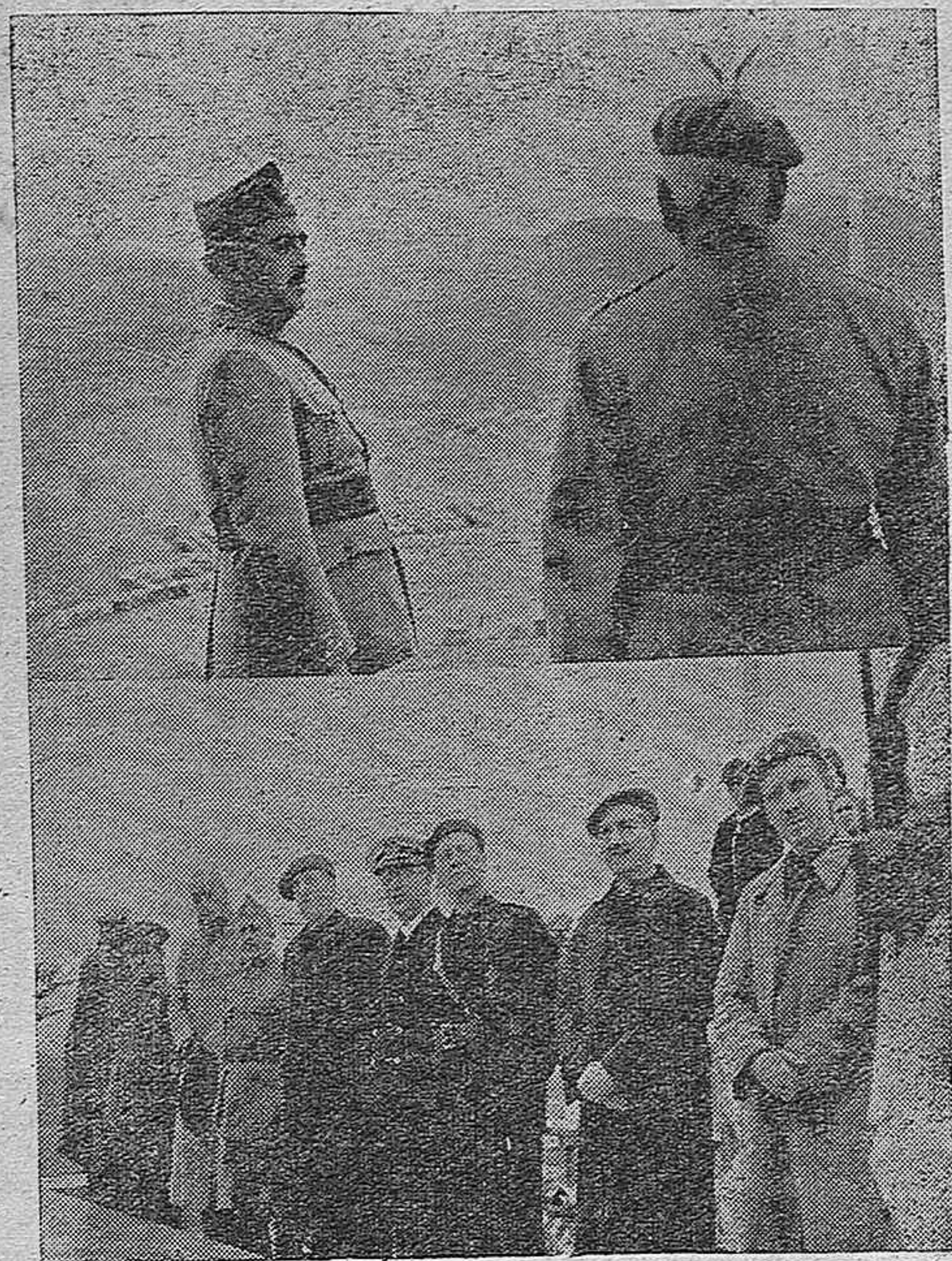
LA INAUGURACION DEL MONUMENTO A MOLA.—El Generalísimo con el general López Pinto en lo alto del Monumento.—El Gobierno durante la celebración de la misa de campaña.