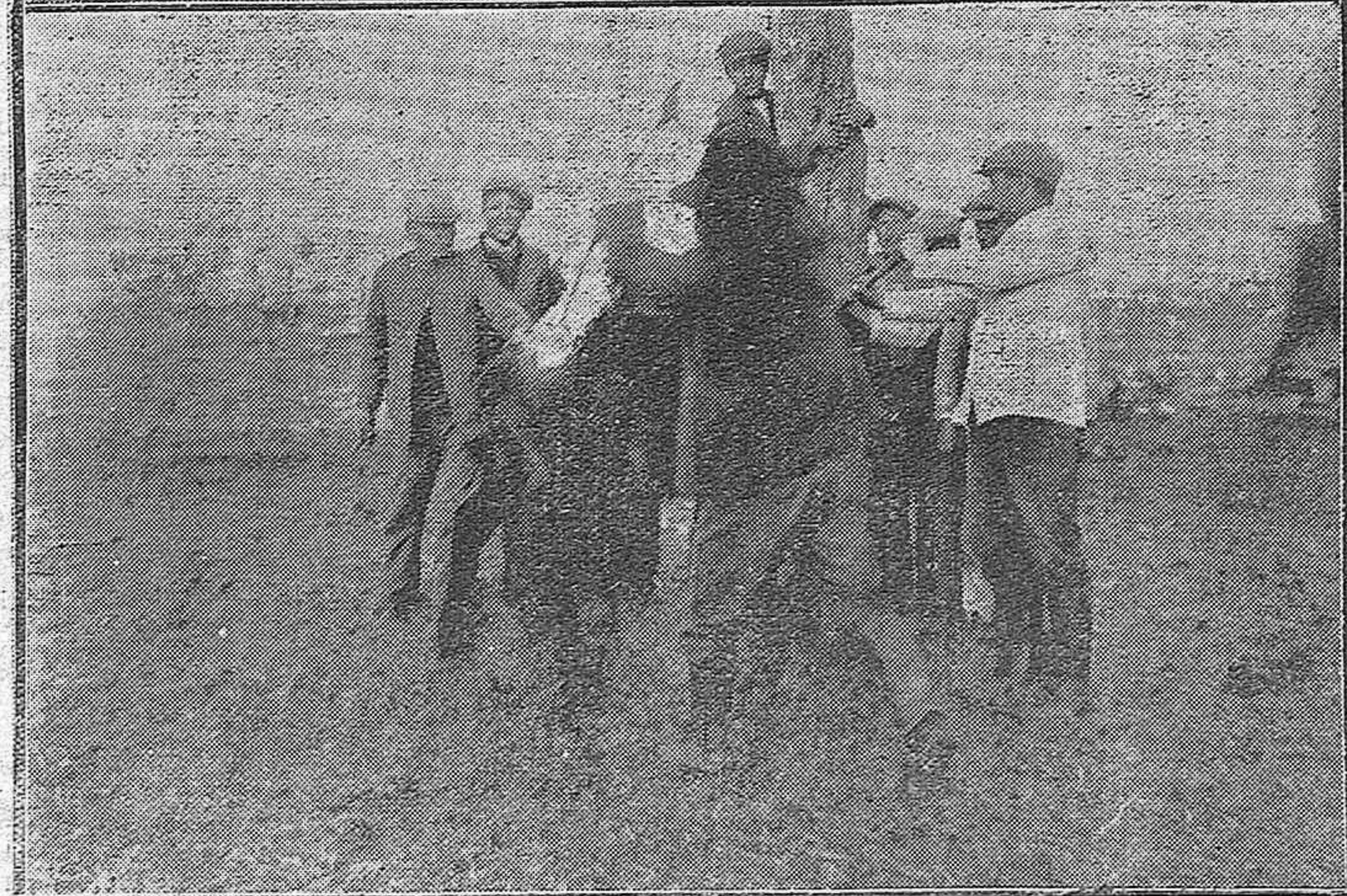
POR LOS CAMPOS CORDOBESES.—Aspecto de una casa de campo en la campiña de Córdoba.—La operación de aplicar el hierro a un muleto en el patio de una casa de labor.