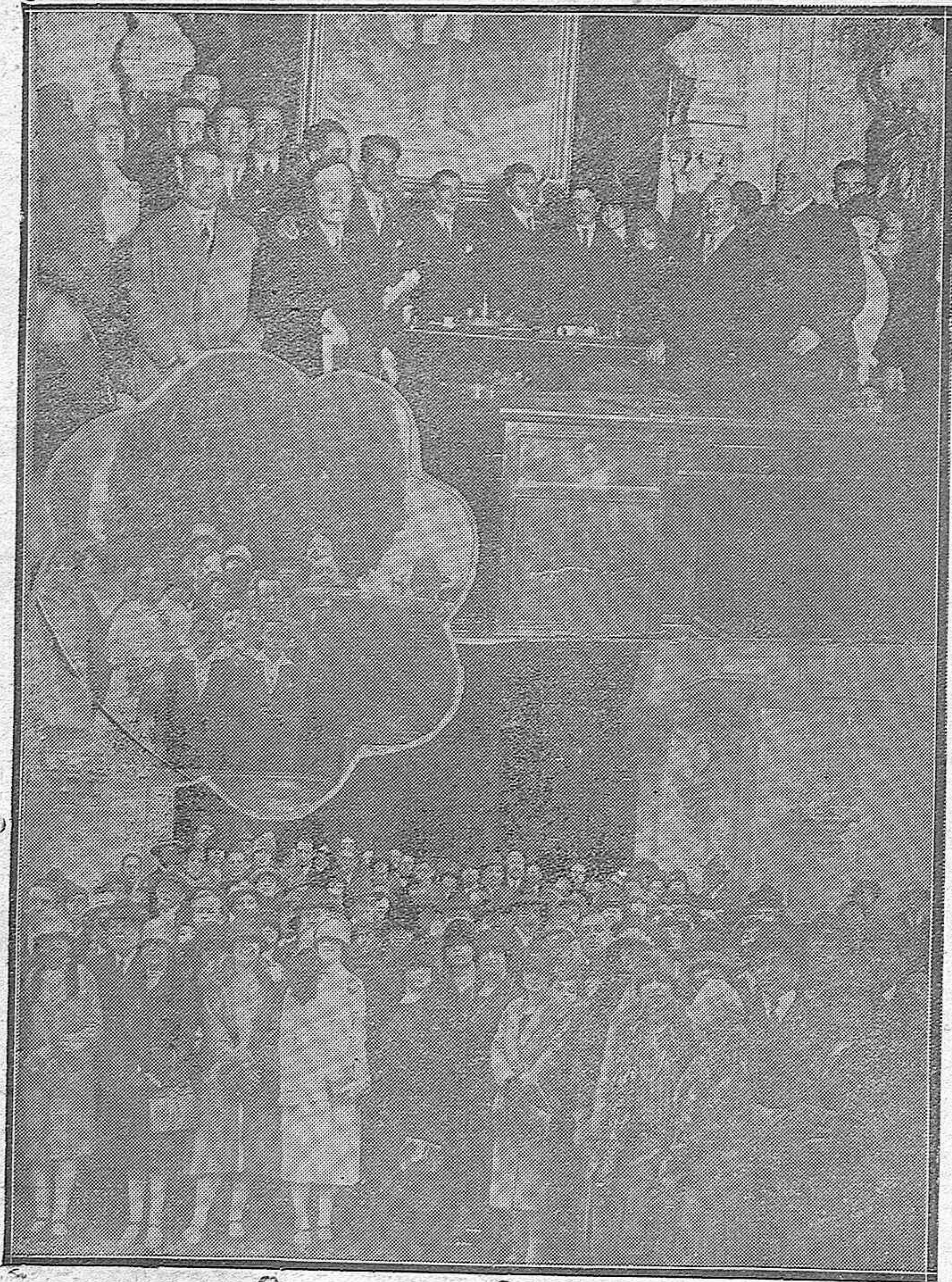
LOS EXCURSIONISTAS MALAGUEÑOS EN CÓRDOBA.—El salón de actos del Ayuntamiento durante la recepción celebrada en honor de nuestros huéspedes.—Los excursionistas al salir de la Mezquita-Aljama.—En el centro:) Grupo de excursionistas en el jardín del Museo de Bellas Artes.