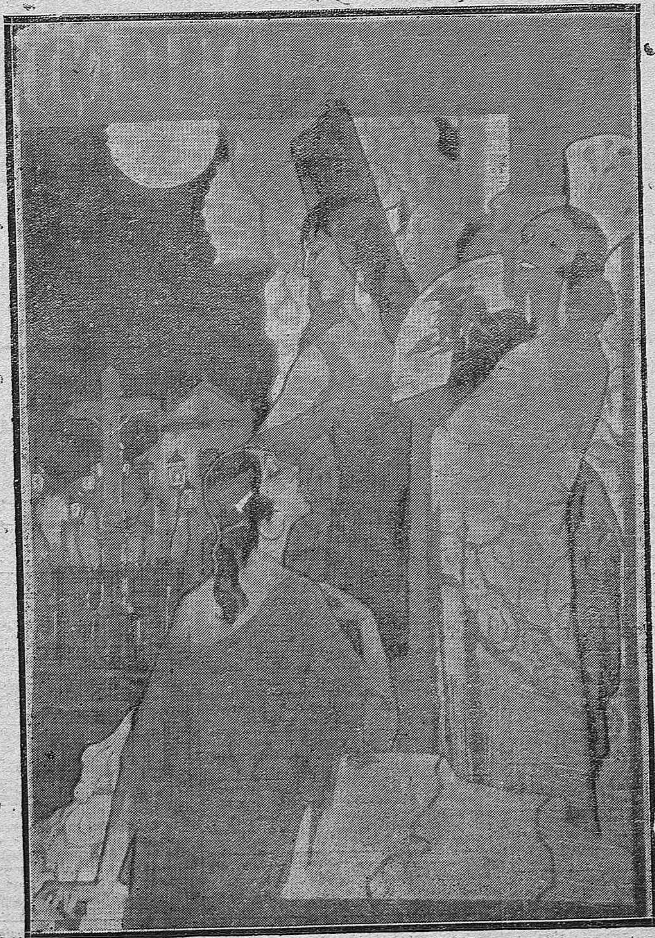
EL CONCURSO DE CARTELES PARA LA FERIA. -- El boceto titulado "La copla," inspirada concepción de cordobesismo y obra admirable de técnica y colorido.