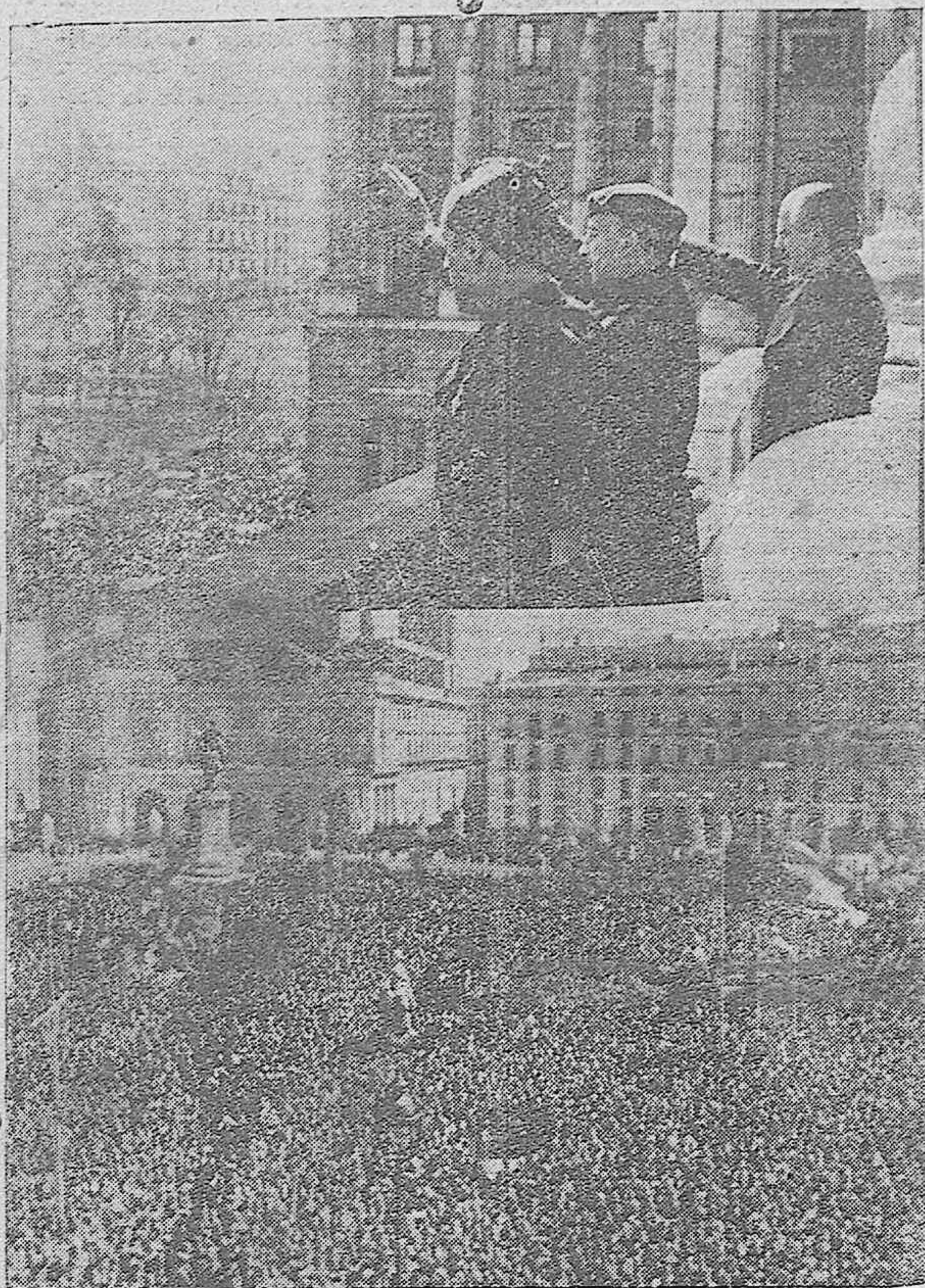
En Madrid, el Caudillo, corresponde a las aclamaciones del pueblo situado ante el Palacio de Oriente, con motivo del aniversario de la liberación de la capital de España. Acompañan al Jefe del Estado los señores Serrano Súñer y Foxá.—Un aspecto de la Plaza de Oriente durante el acto de homenaje al Generalísimo

Redacción, Administración y Talleres FALANGE ESPAÑOLA TRADICIONA- LISTA Y DE LAS JONS Puerta del Rincón :-: Teléfono 2436 Apartado de Correos número 2