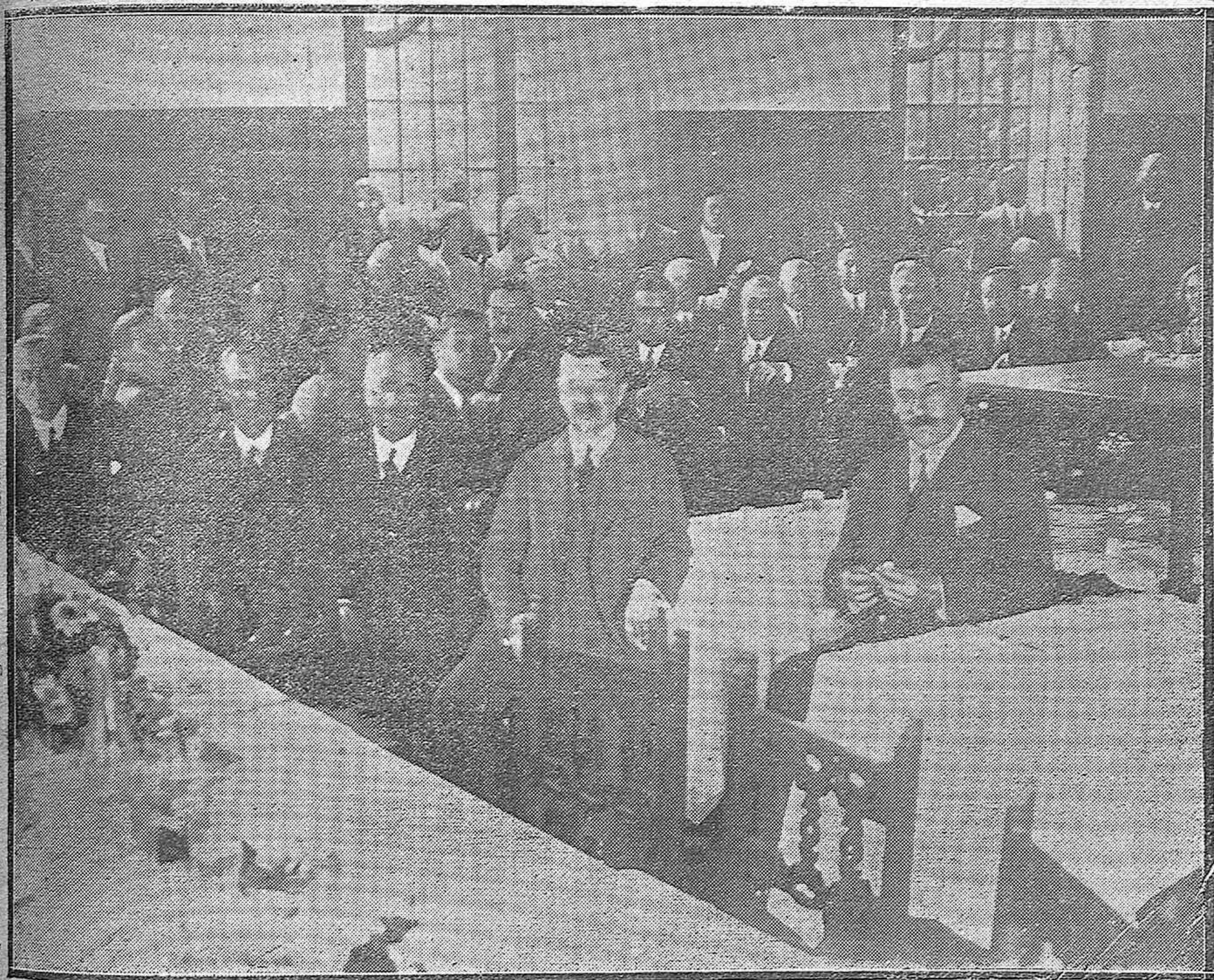
Banquete celebrado en honor de los Congressistas del Hierro y del Acero, que han visitado detenidamente nuestra ciudad.