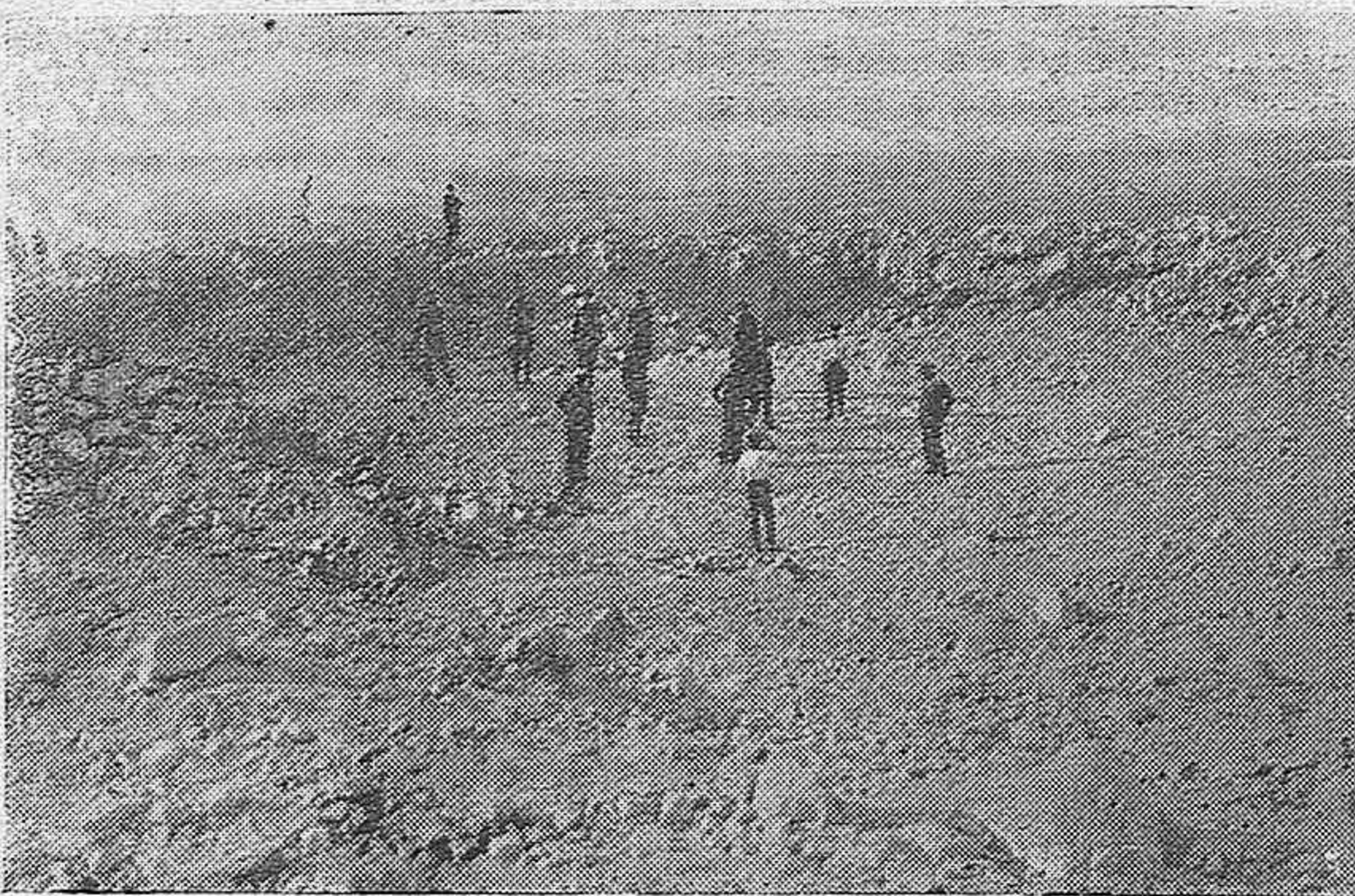
LUGAR DONDE ESTABA EMPLAZADO EL FUERTE DE CABRERIZAS BAJAS, QUE DAMOS EN NUESTRA PORTADA, TAL COMO QUEDÓ DESPUÉS DE LA EXPLOSIÓN.— UN PARAJE YERMO, DESOLADO, HOSTIL, DONDE NO QUEDÓ PIEDRA SOBRE PIEDRA NI EL MENOR RASTRO DE LA EDIFICACIÓN.

Toda la correspondencia al Director, excepto la exclusivamente administrativa que se dirigirá a la Administración.