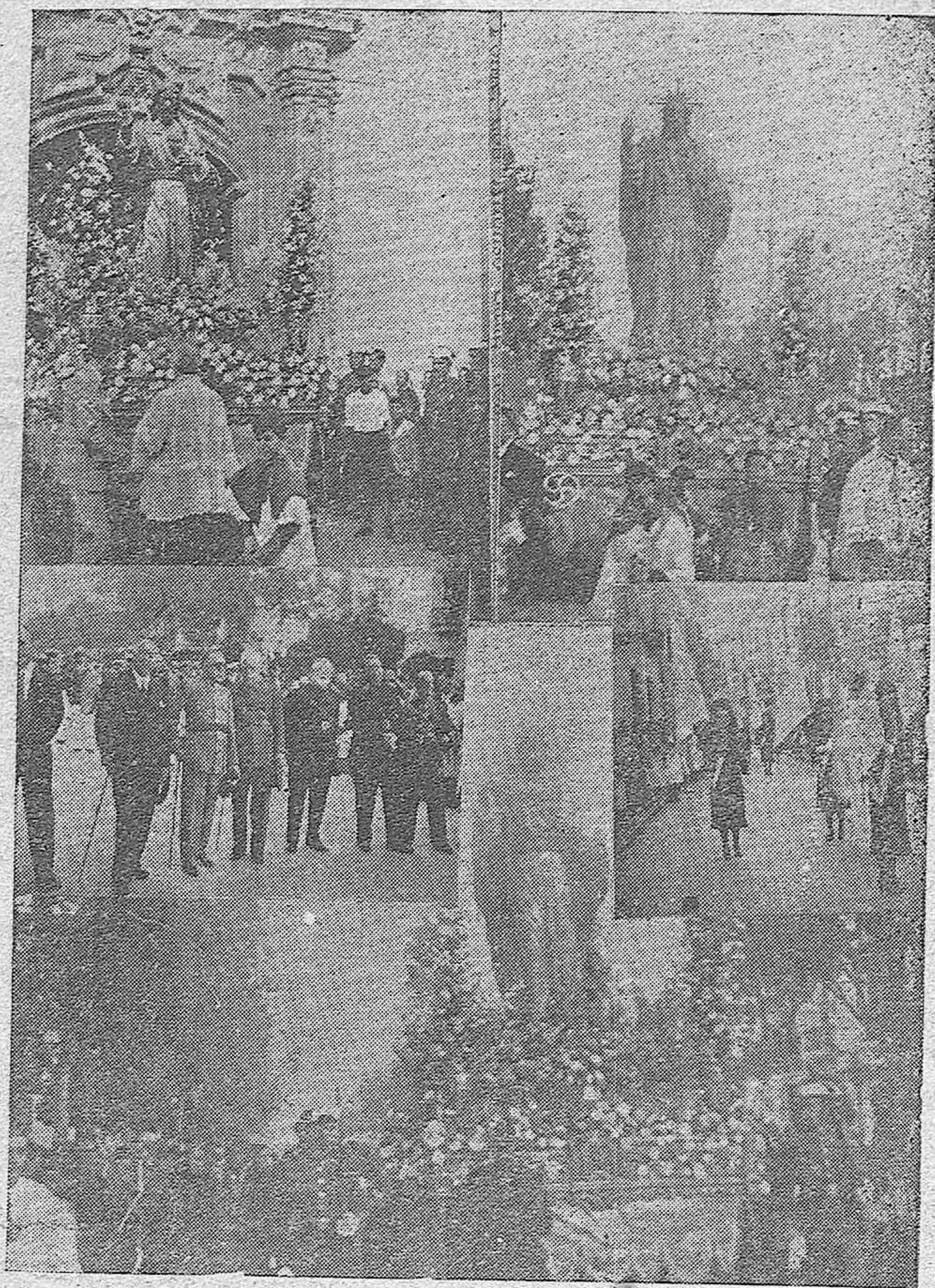
PROCESION DEL SAGRADO CORAZON DE JESUS EN CORDOBA.—Diversos aspectos de la procesión en su magnífico desfile por las calles de la ciudad.