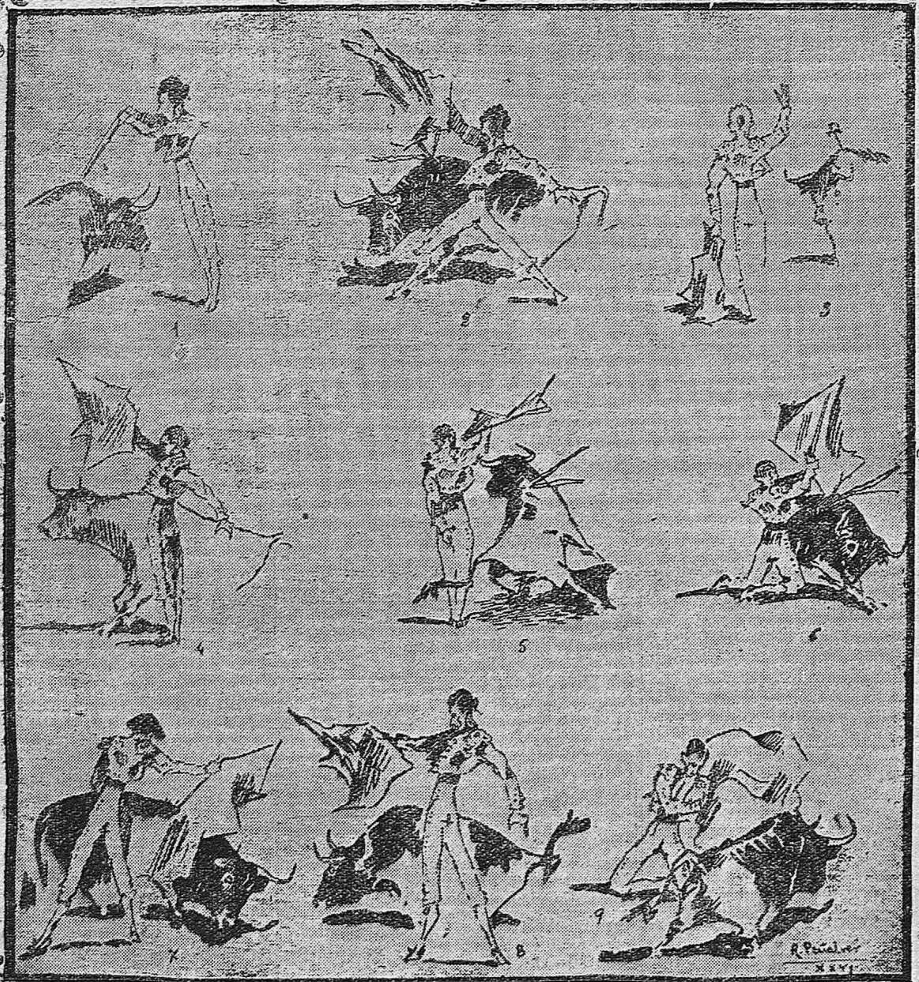
De las corridas de Posadas.—1, 2, 3) Alamares en el tercer día.—4, 5, 6) Rubito de la Estación en el 2.º día.—7) Adrián Peñalver en una gran verónica el segundo día.—8, 9) El mismo diestro el tercer día.