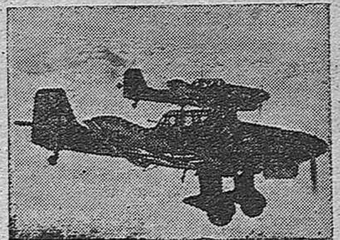
Aviones en vuelo hacia los objetivos

En cuanto a la aviación francesa—bastante inferior siempre a la R. A. F.— se verá obligada a luchar en los dos frentes, lo que hará complicadísimo su cometido. De este modo la aviación italiana podrá,