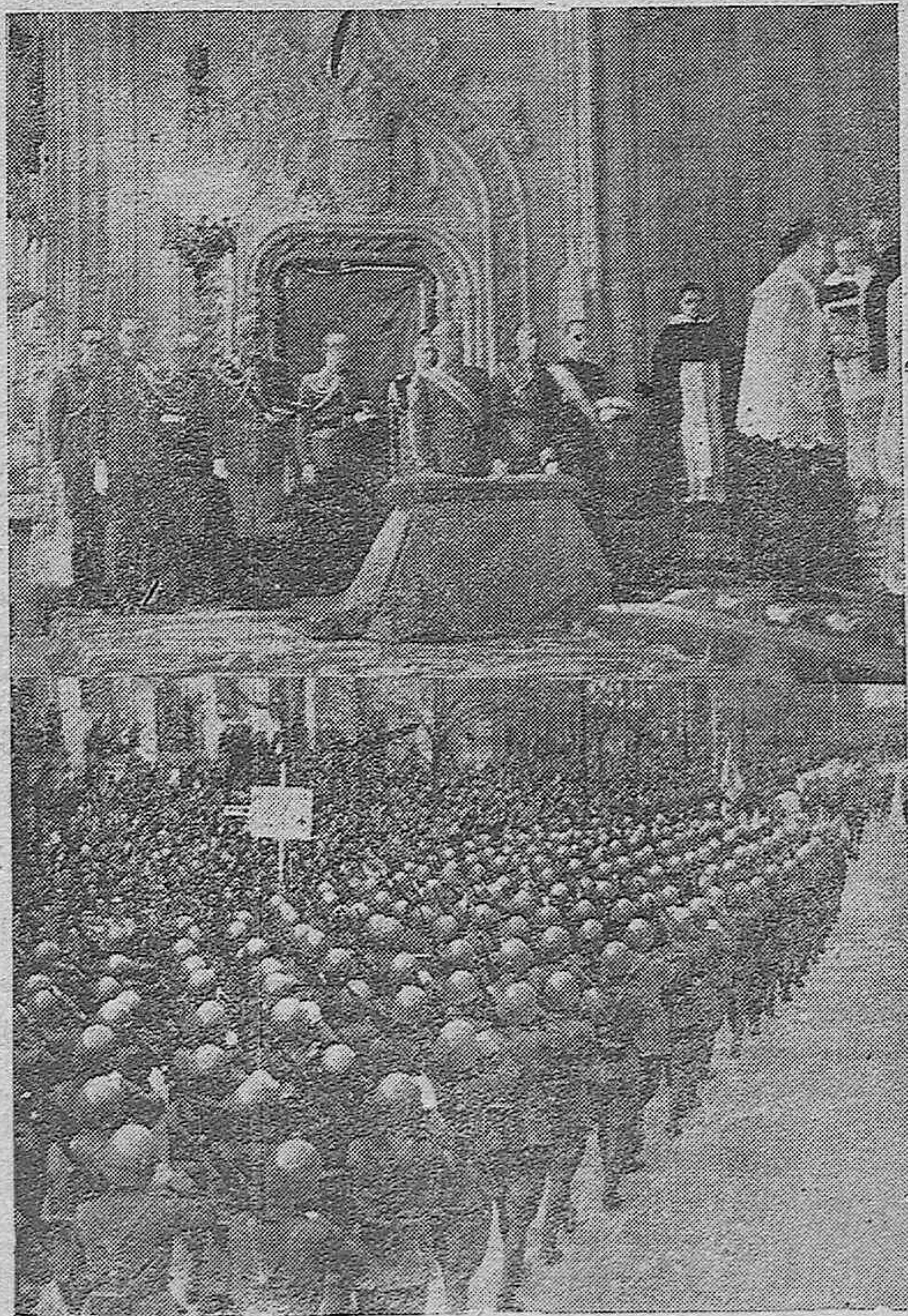
S. E. el Generalísimo en el solemne «Te-Deum» celebrado en la Iglesia de los Jerónimos.—Un momento del gran desfile militar, ante el Caudillo, con motivo de la gloriosa efemérides

Por ello, el general Saliquet, en la recepción militar del día de la Victoria, ha recogido con laconismo militar y certera visión de patriota, el sentir de todos los buenos españoles, cuando ha saludado a Franco como al único Caudillo militar y civil doble ad-