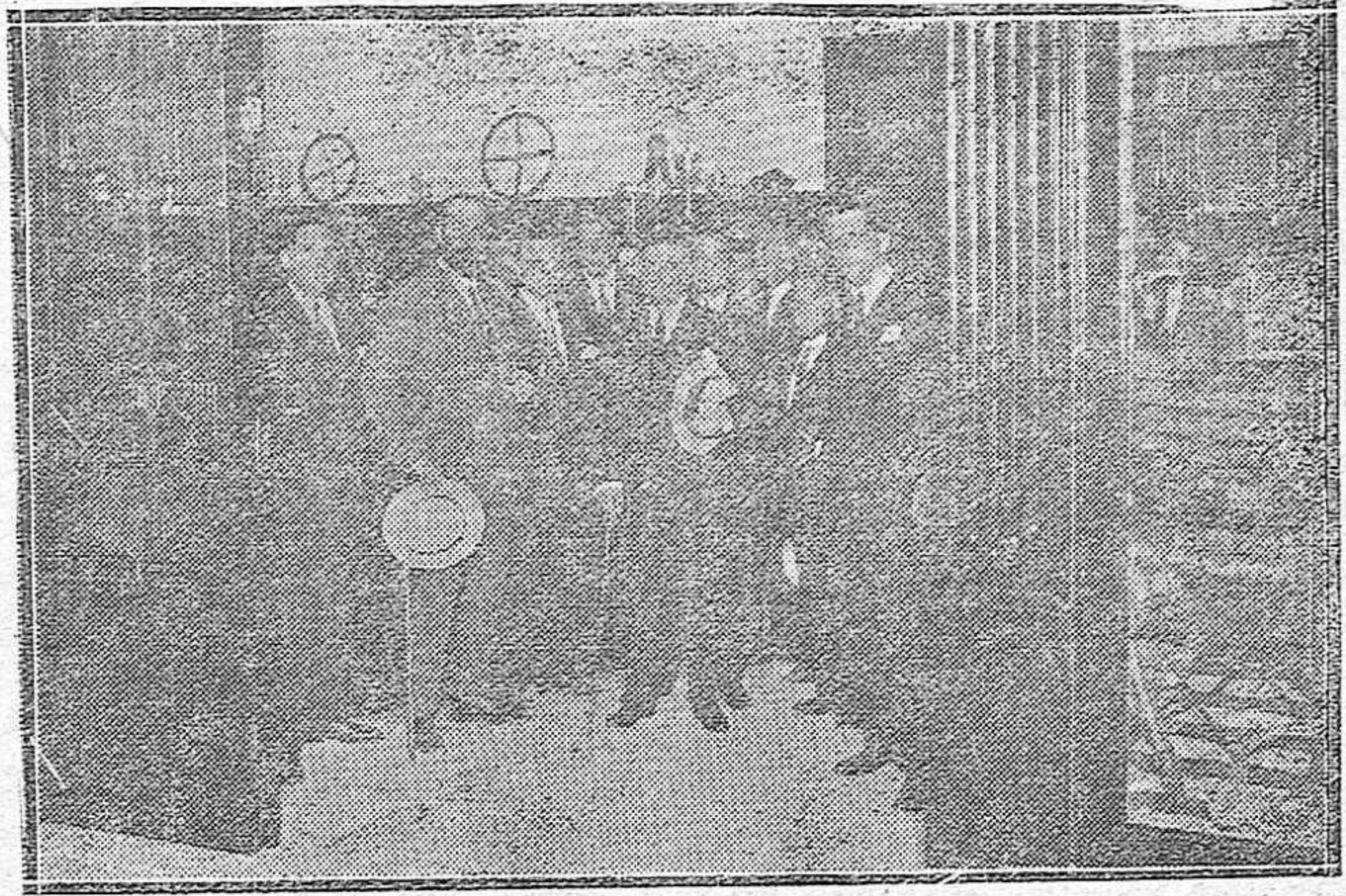
EL CRUZ CONDE EN COMPAÑÍA DE OTROS INVITADOS A LA INAUGURACIÓN DEL Suntuoso Establecimiento.