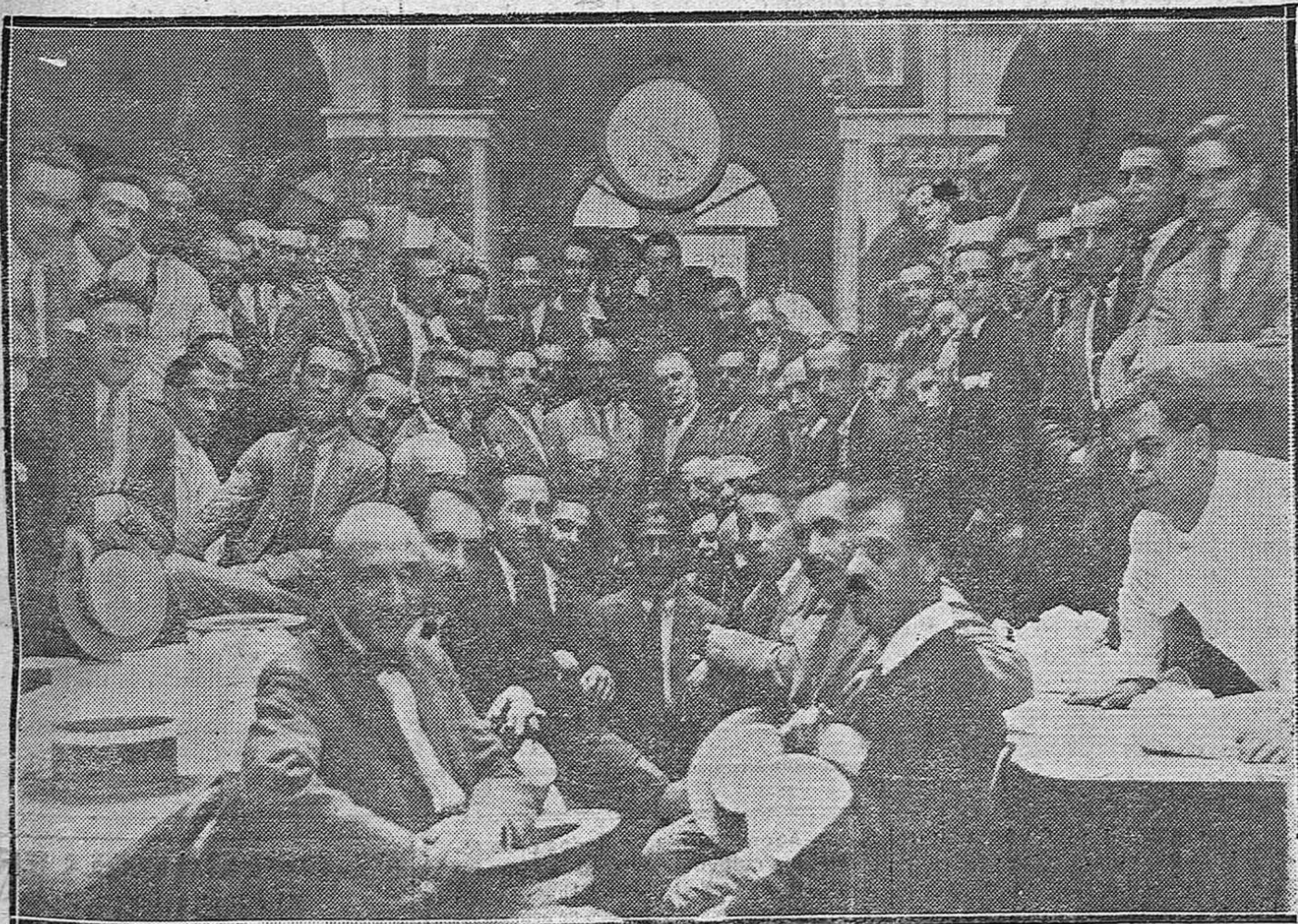
EMPLEADOS MERCANTILES QUE CONCURRIERON AYER AL SIMPÁTICO ACTO DE CONFRATERNIDAD ORGANIZADO PARA FESTEJAR EL ANIVERSARIO DE LA CONSTITUCIÓN DE SU MONTEPIO.

Jamones serranos sin grasa; Salchichión cu'ar, embuc'ado y lomo, calidad garantizada, se sirven por piezas y por raciones. -Confitería Victoria, Salomón Sabal.