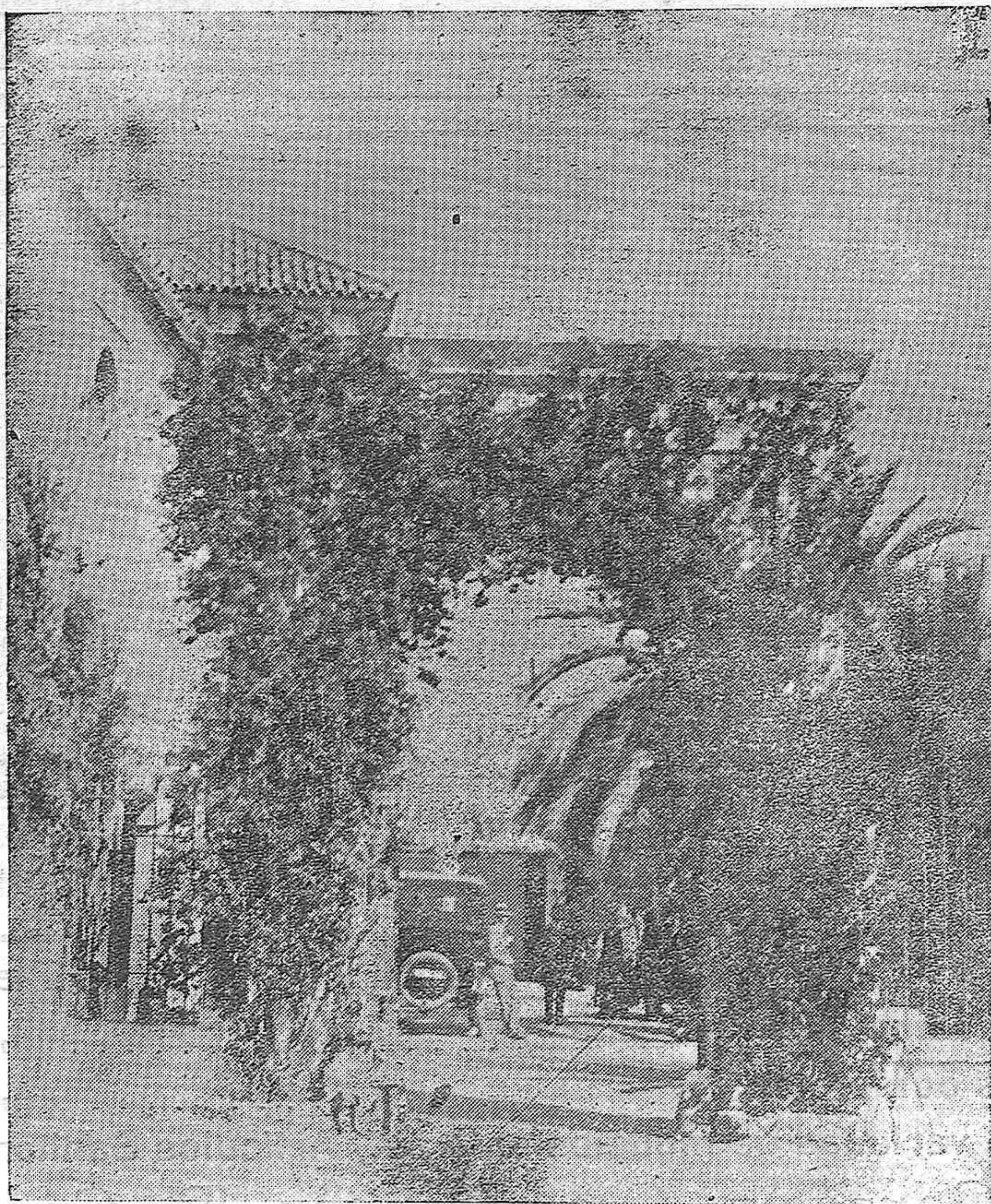
RINCONES PINTORESICOS DE LA SIERRA.—ENTRADA PRINCIPAL DE LA HUERTA LAS ANTAS.