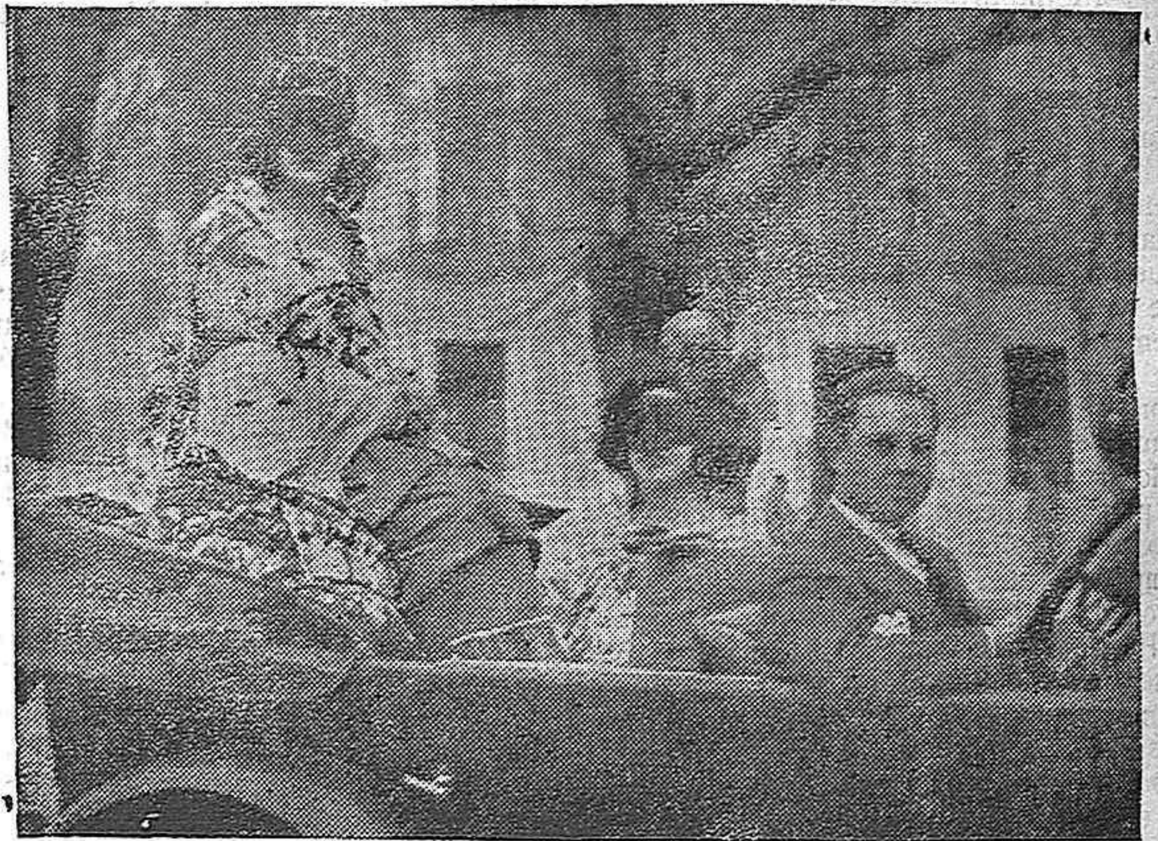
AUTO OCUPADO POR LINDAS MASCARITAS