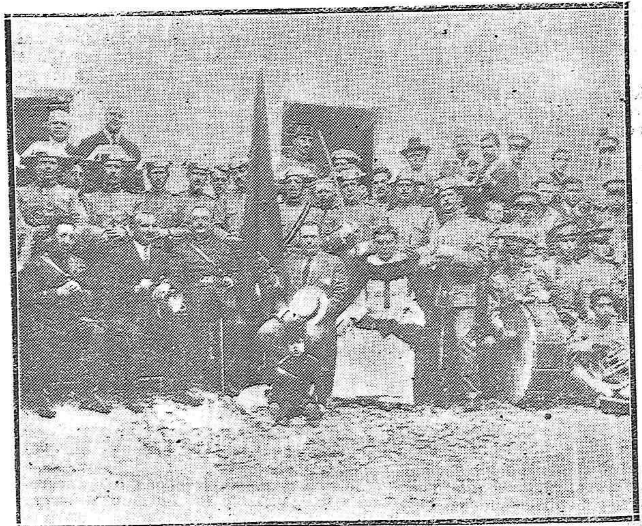
VILLA DEL RIO.—ACTO SOLEMNE DE ENTREGARSE POR LAS AUTORIDADES LA BANDERA A LA GUARDIA CIVIL DE AQUELLA VILLA.

Almacenistas importadores de café CÓRDOBA