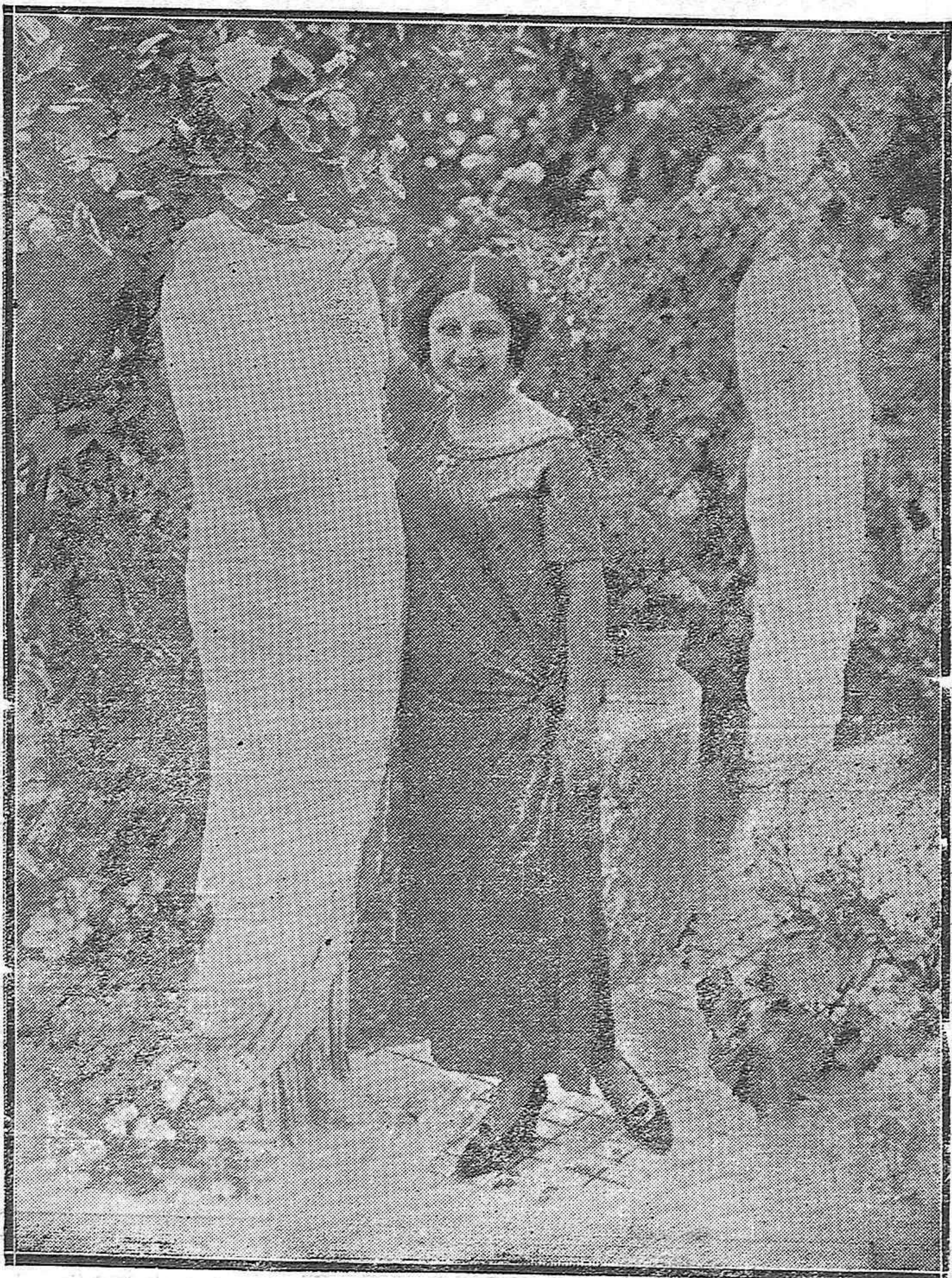
LA BELLISIMA ARTISTA LOLITA ASTOLFI, QUE ACTÚA EN EL GRAN TEATRO.