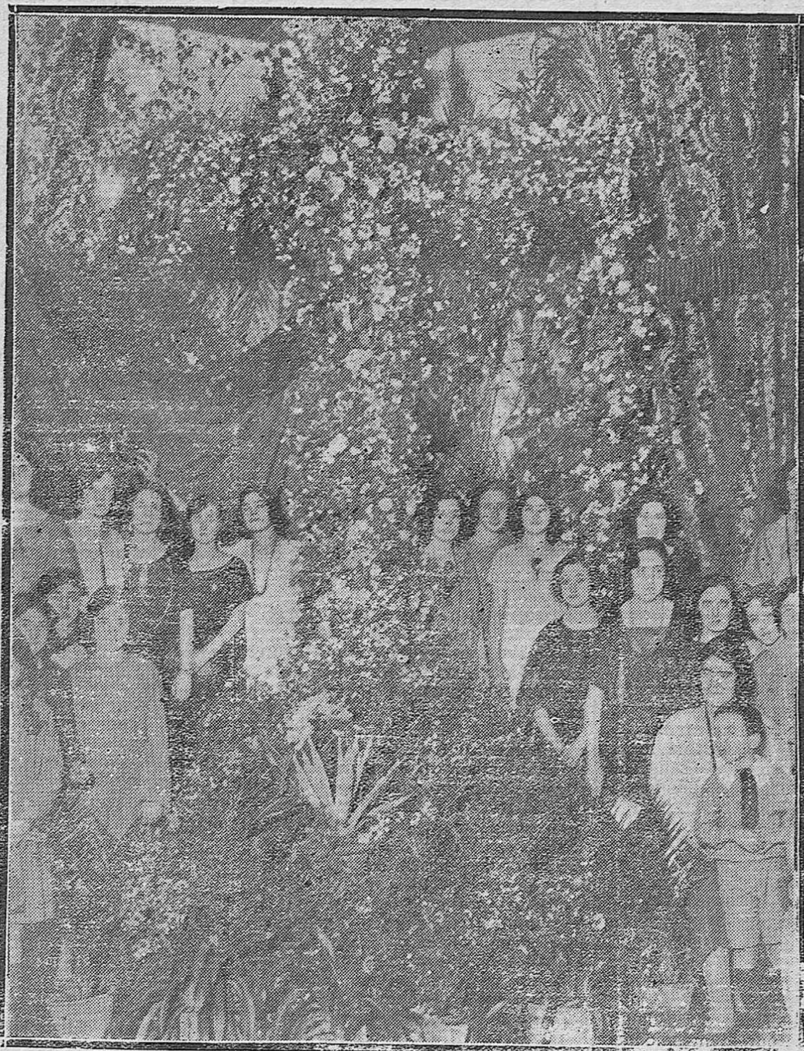
EN EL CENTRO FILARMÓNICO