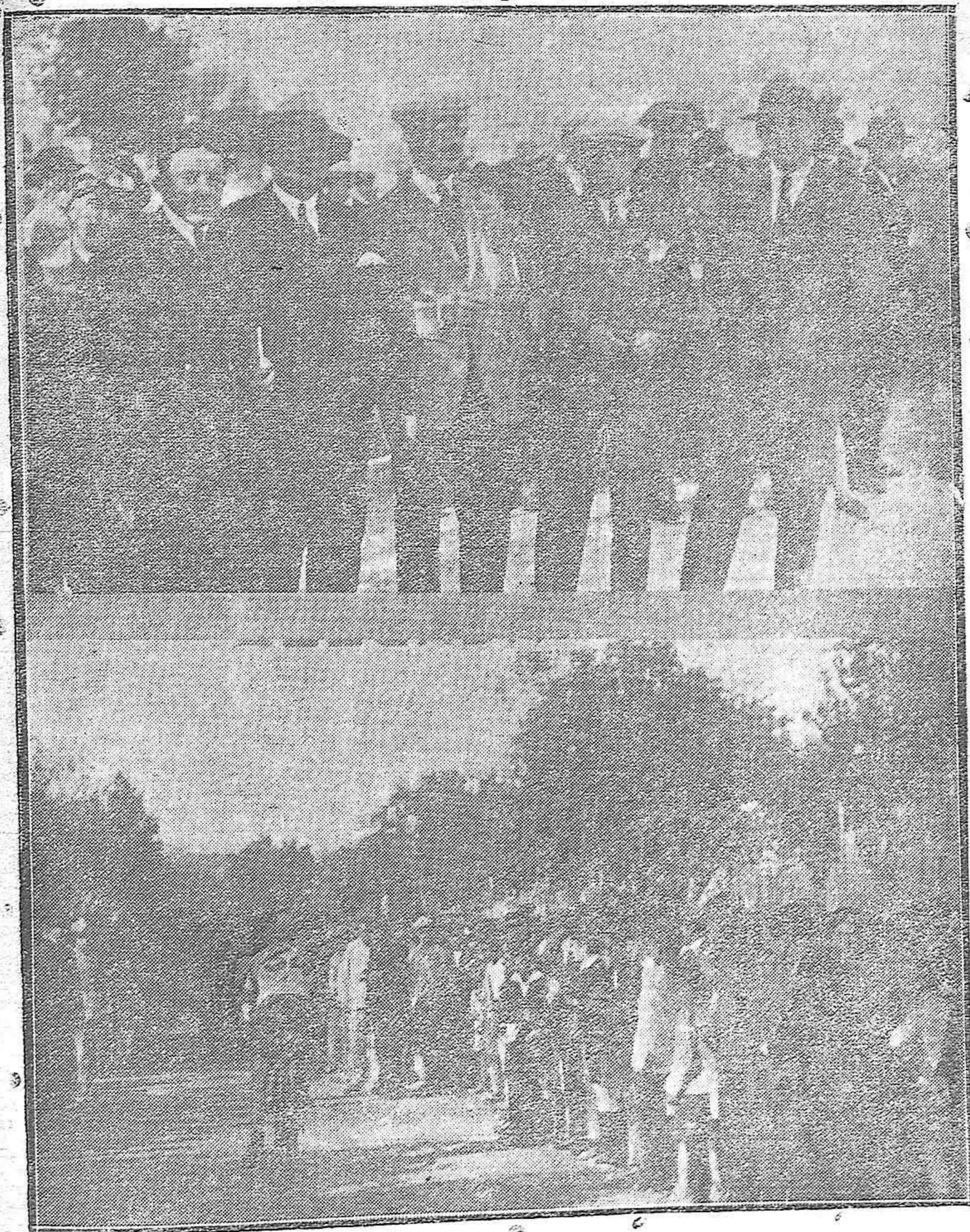
LA PRIMERA VUELTA CICLISTA DE ANDALUCÍA.—El Jurado calificador de llegada en la meta del Paseo de la Victoria.—Aspecto del paseo en el momento de pisar la cinta el primer corredor.