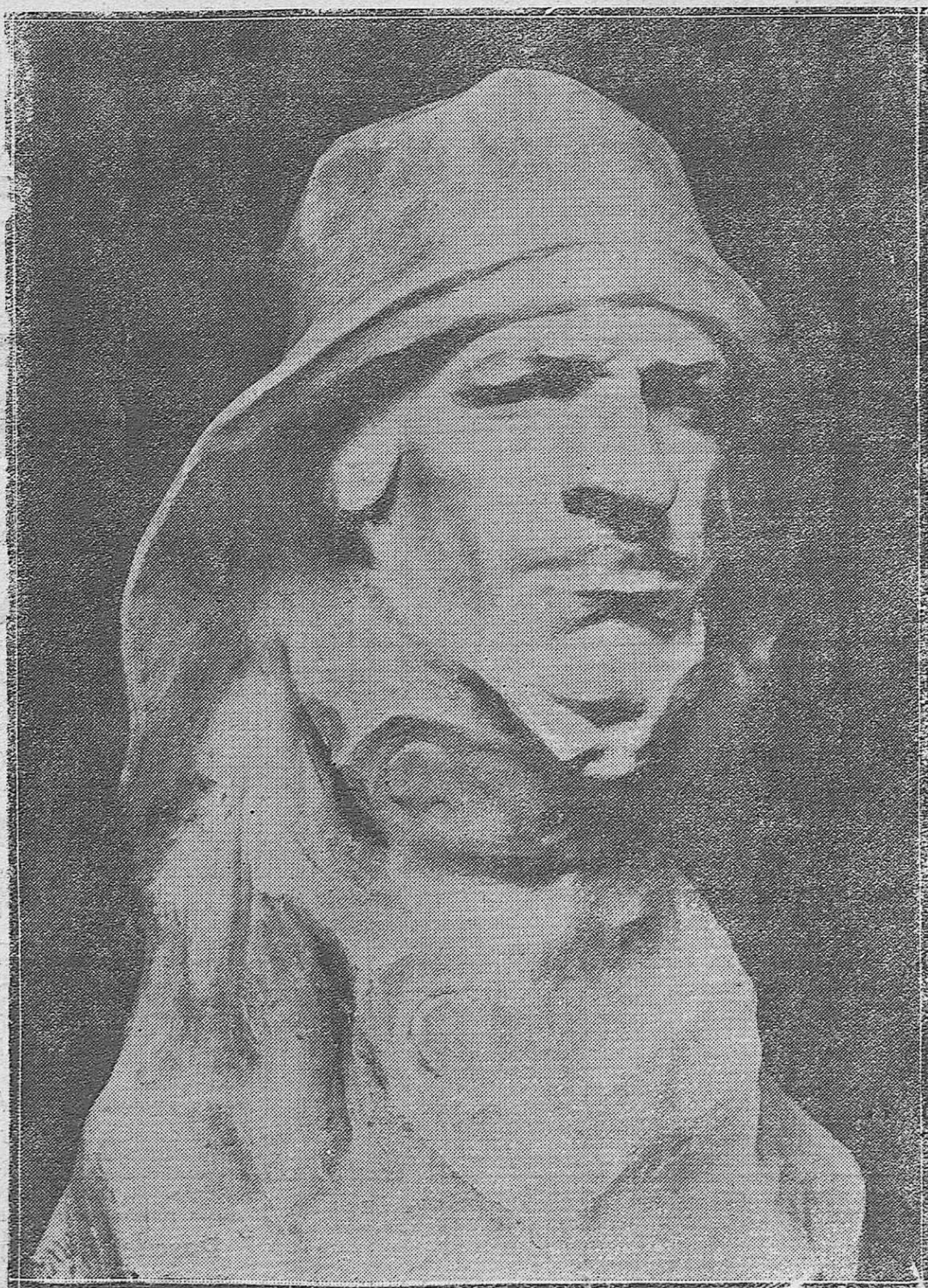
DE LA EXPOSICIÓN INURRIA.—Marino mercante.