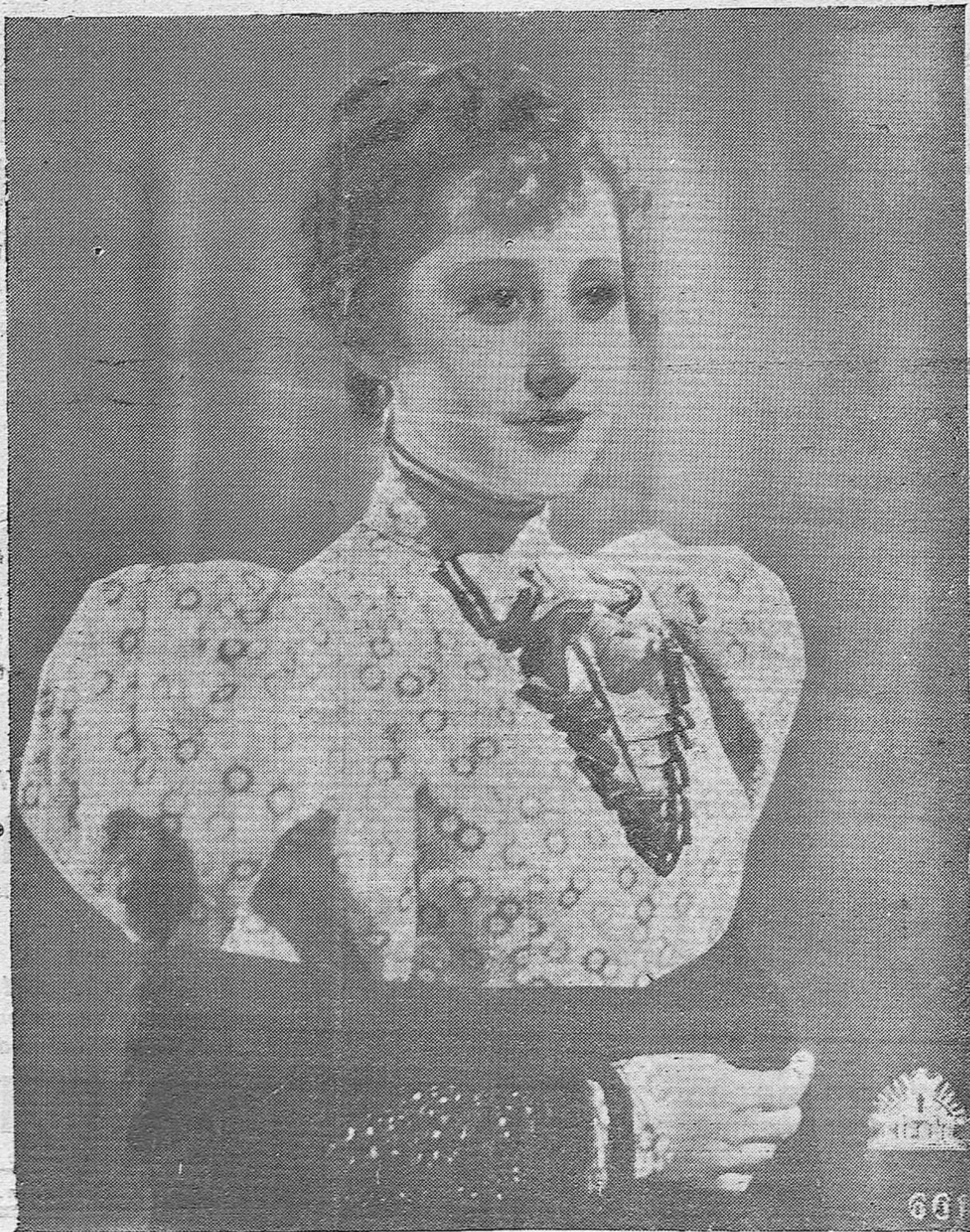
La bellissima artista española Raquel Rodrigo en el papel de "Susana" de la superproducción Cifesa "La Verbena de la Paloma", que se estrena en el Gran Teatro, el 25 de Diciembre.