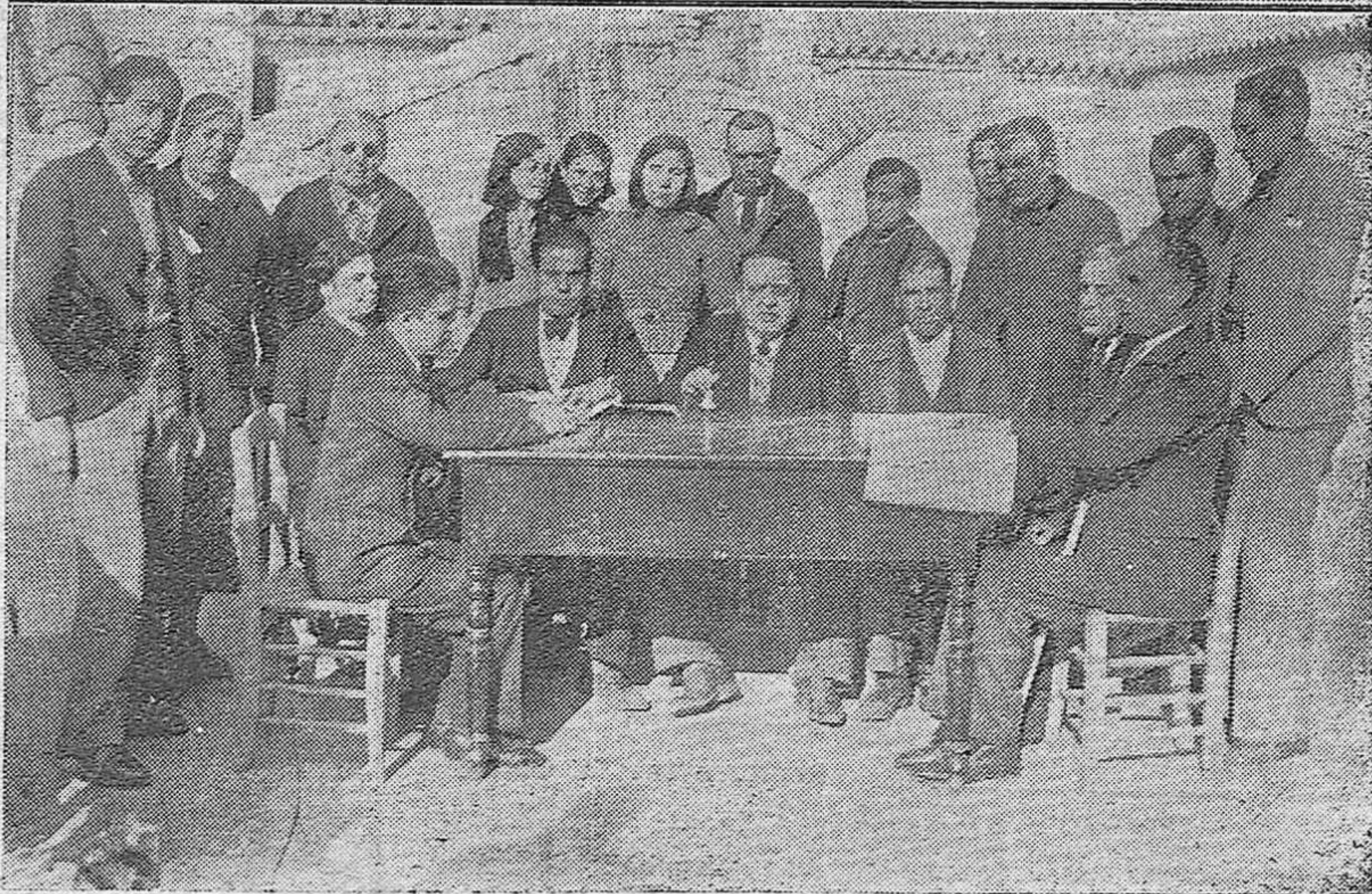
Dos detalles de la Asamblea de Ciegos celebrada en el local de su Asociación Provincial. Concurrieron al acto varios delegados, acordando solicitar ayuda de los videntes para los fines benéficos de la Agrupación.