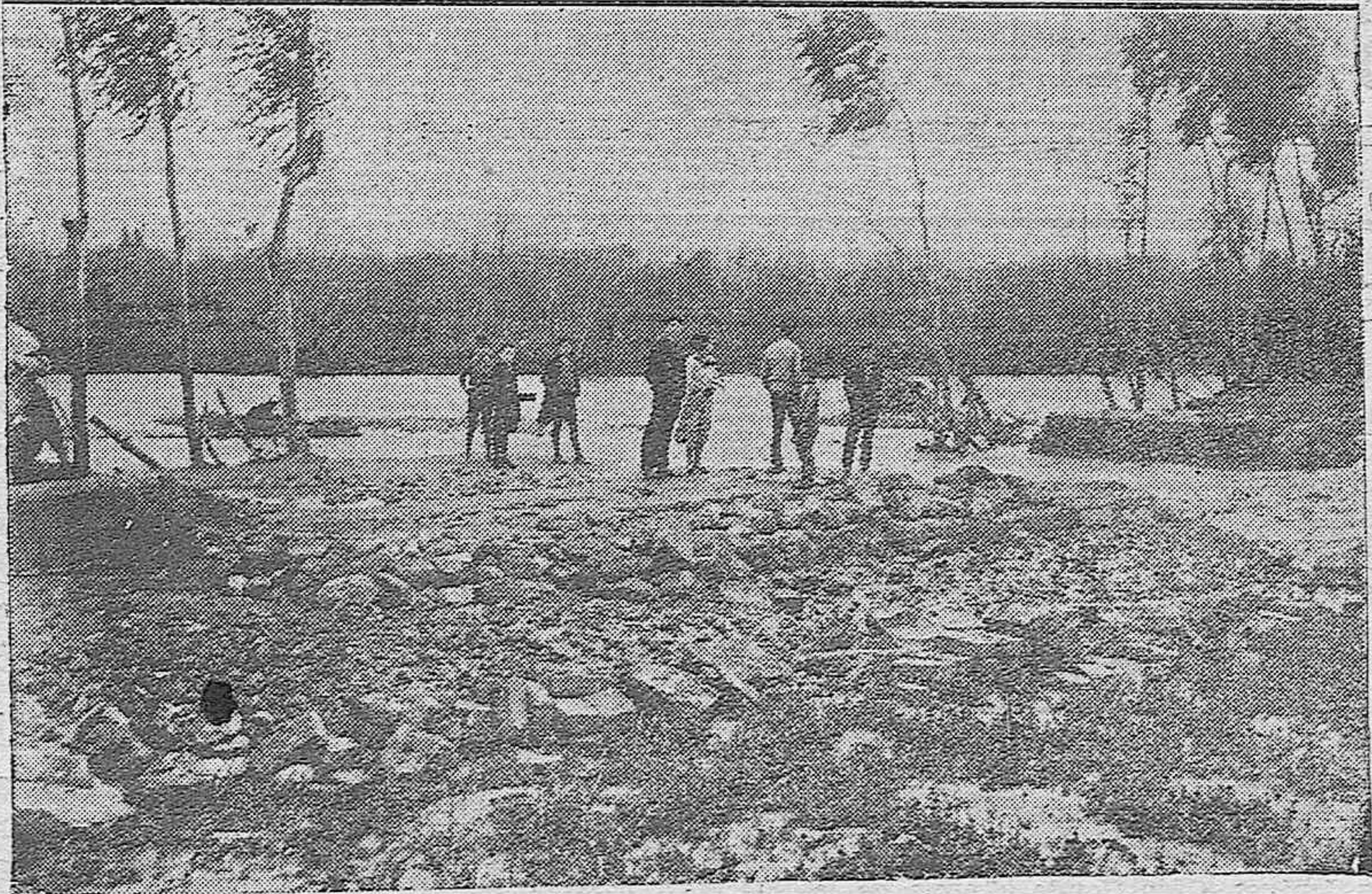
Arriba: Se celebró la Asamblea en la Sociedad Deportiva de Caza y Pesca, siendo elegida la nueva Junta Directiva para el año actual.—Abajo: A causa del pasado temporal y viento huracanado se hundió un muro, cortando la carretera y el puentecillo en el camino del Arenal, próximo a la barriada de la Fuensanta.