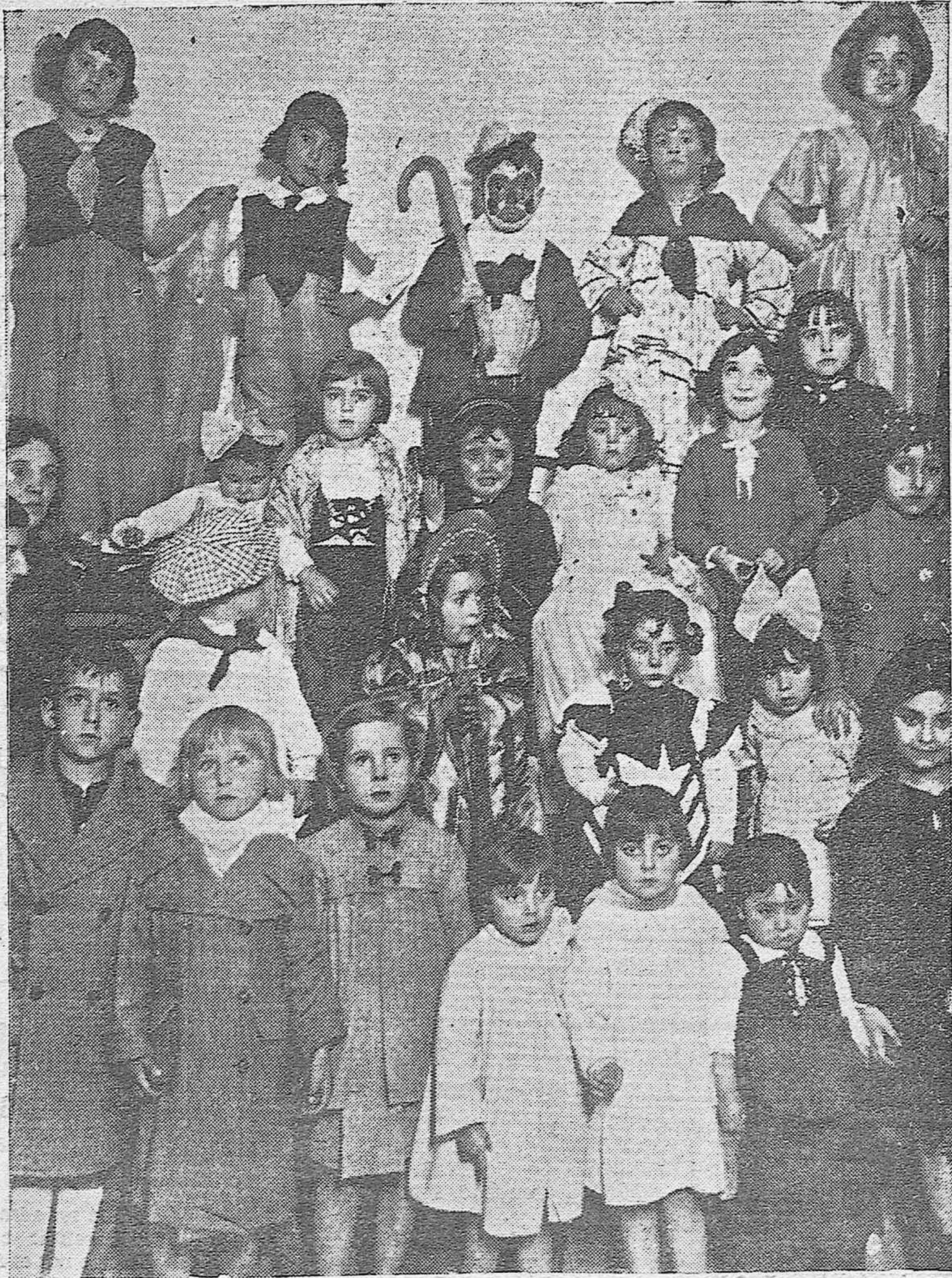
En el Centro Filarmónico se celebró el Festival Infantil.—Niños disfrazados que asistieron al baile.