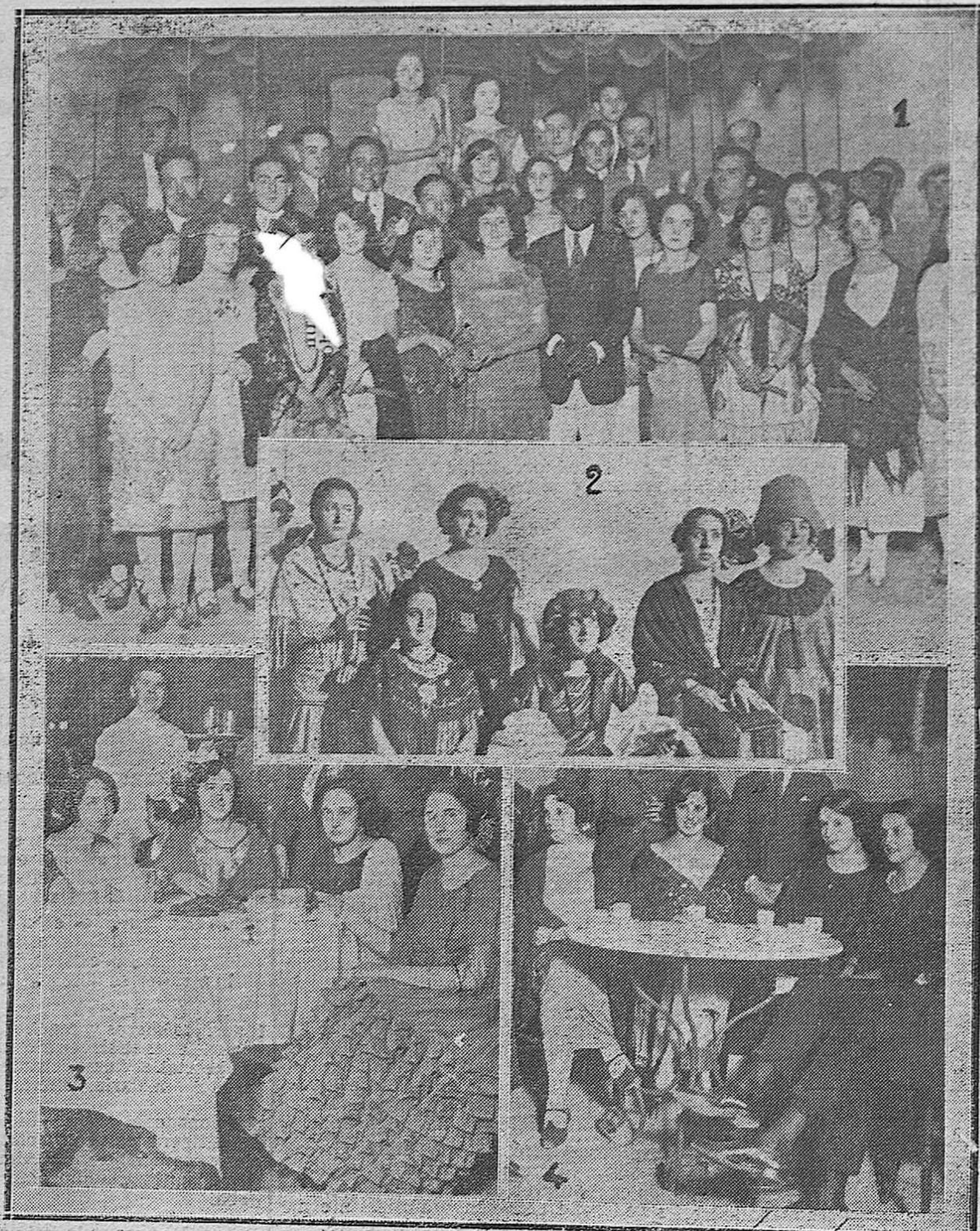
1) LINDAS VERBENERAS CONCURRENTES A LA VELADA DE SAN PEDRO EN EL CIRCULO DE LA AMISTAD.—2) SEÑORITAS PREMIADAS EN EL CONCURSO DE DISFRACES DEL CENTRO FILARMÓNICO.—3 Y 4) DOS DETALLES DE LA VERBENA DEL CIRCULO.