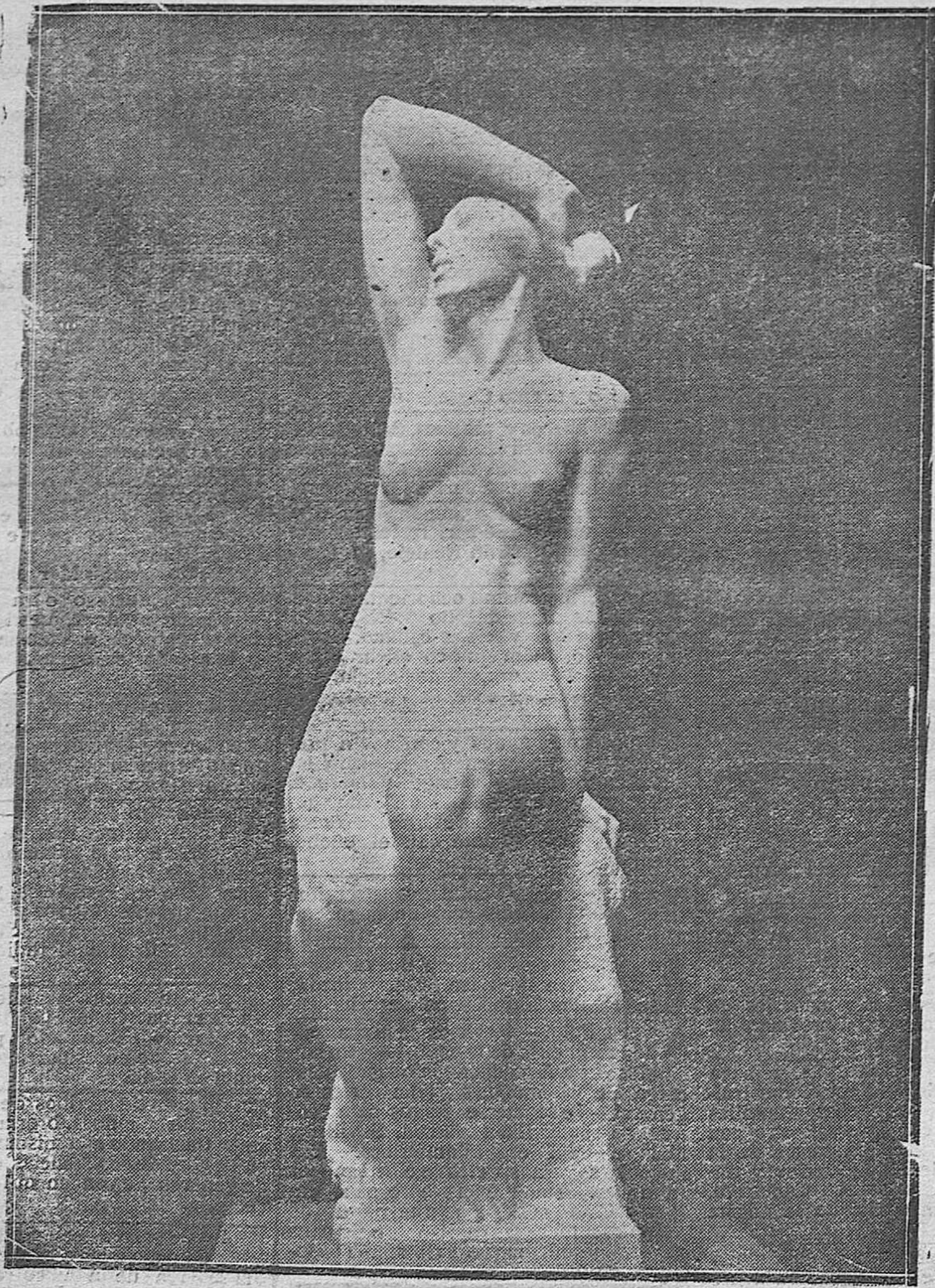
LA OBRA ARTISTICA DEL MALGRADO INURRIA. -UNA DE LAS TRES ESCULTURAS QUE LABRÓ MATEO PARA EL CASINO DE MADRID