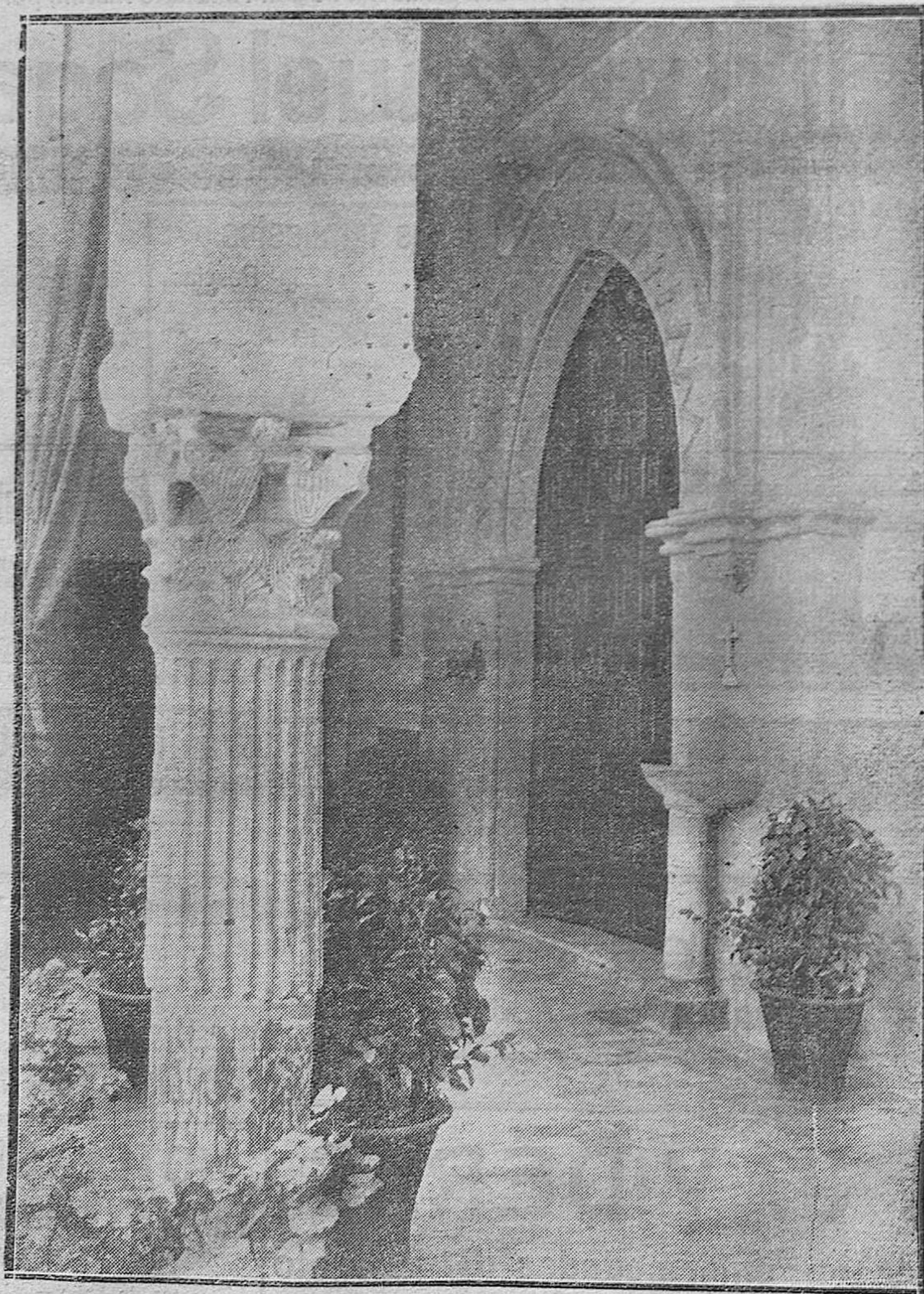
CORDOBA.—ARTISTICA PORTADA Y CAPITEL DE LA CAPILLA DEL HOSPITAL DE AGUDOS, DE EXTRAORDINARIO MERITO.