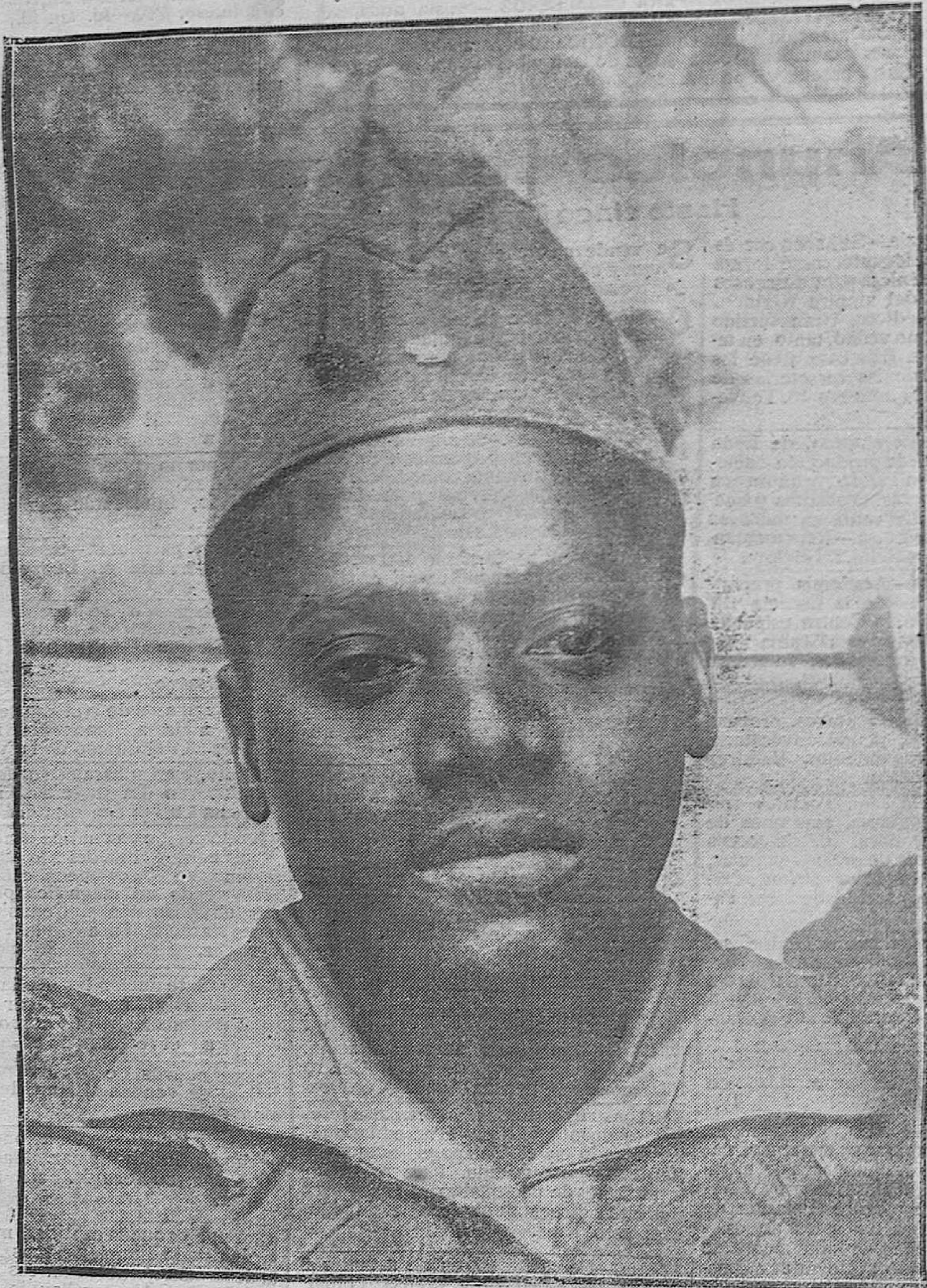
EL PRINCIPE HEREDERO DEL TRONO DE ABISINIA, QUE PROCEDENTE DEL TERCIO EXTRANJERO SE HALLA EN CORDOBA, DESPERTANDO SU FIGURA GRAN CURIOSIDAD.