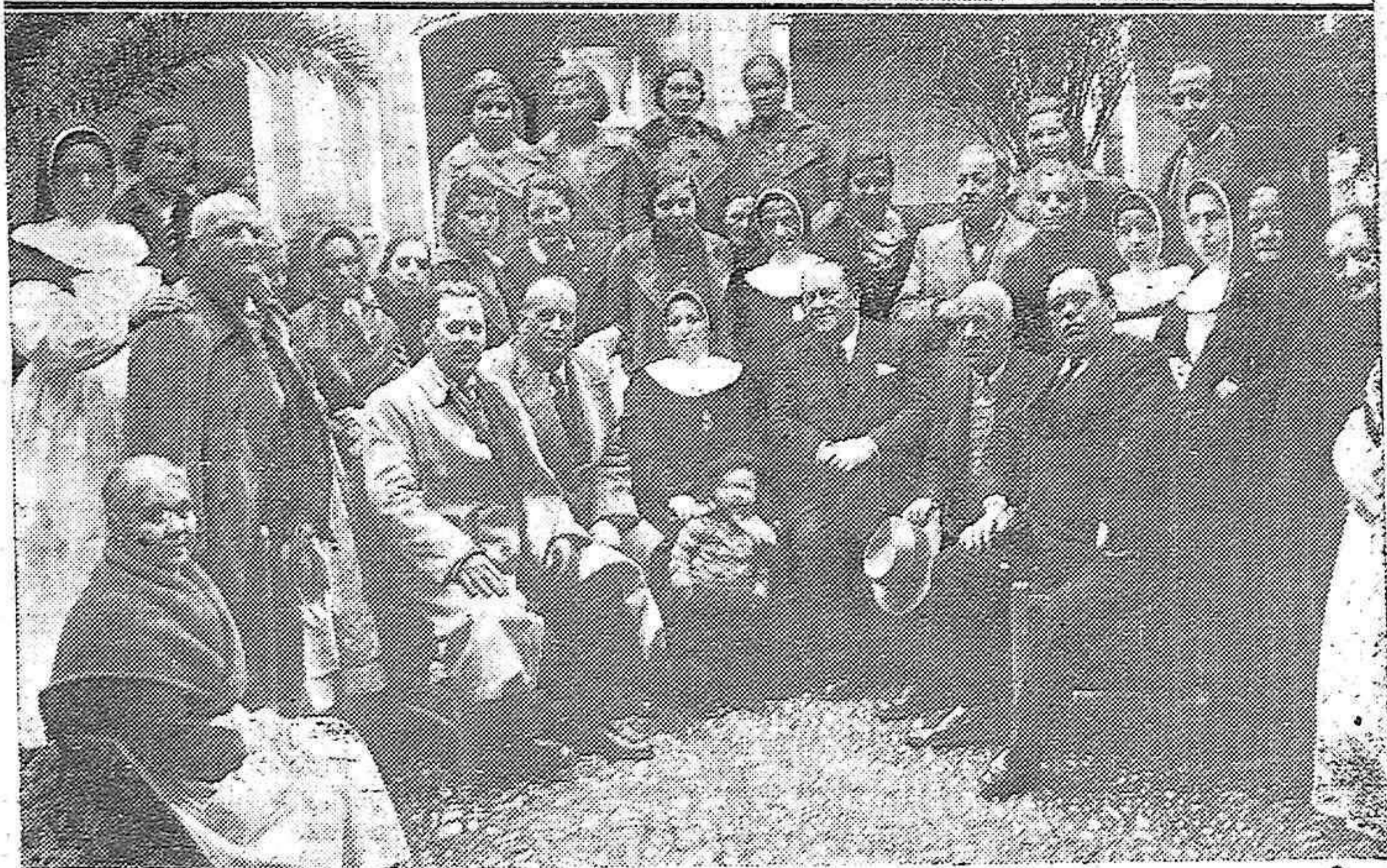
Arriba: Comida dada por el Ayuntamiento a los acogidos en el Asilo de Madre de Dios. Señoritas sirviendo la comida a los pobres.—Abajo: Los concejales que asistieron al acto, con los ancianos acogidos y señoritas que intervinieron en la humanitaria obra.