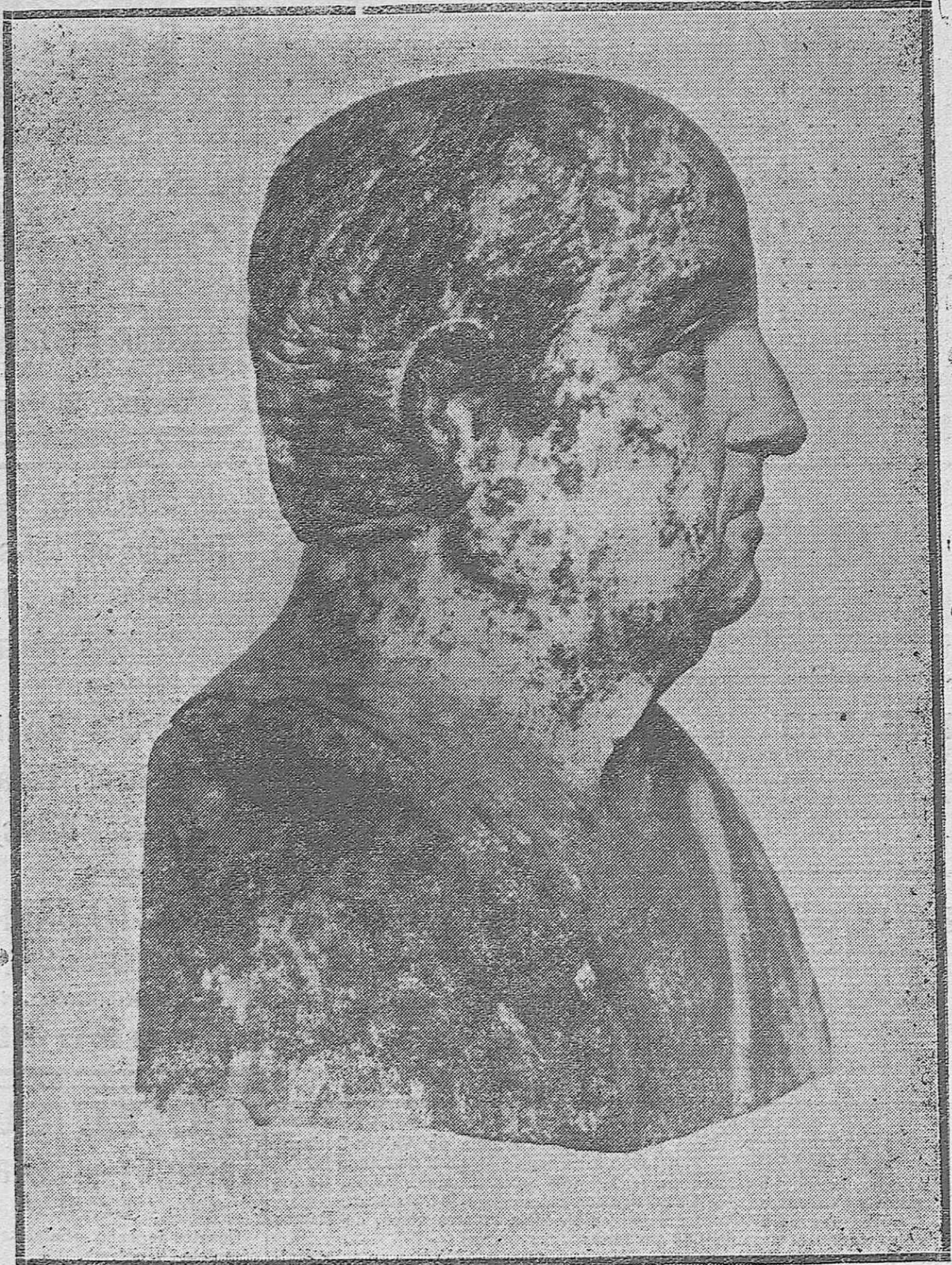
RETRATO DEL MÁS FAMOSO DE LOS CORDOBESES.—Lucio Anneo Séneca, cuyo original se conserva en el «Altes Museum» de Berlín.