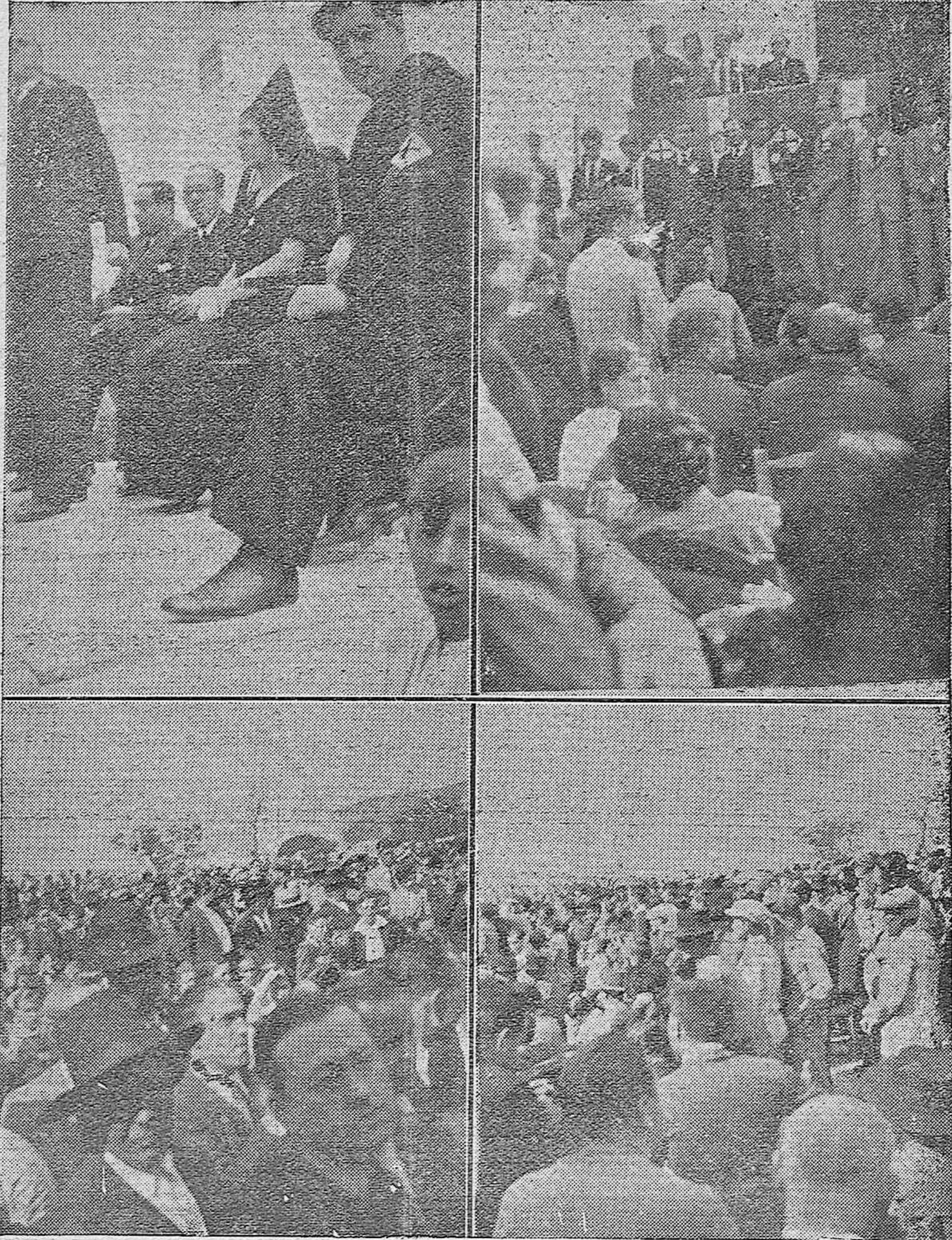
El acto de la Juventud de Acción Popular en Lucena

Varios aspectos del acto celebrado por las Juventudes de Acción Popular en Lucena, el domingo 20 de Octubre.