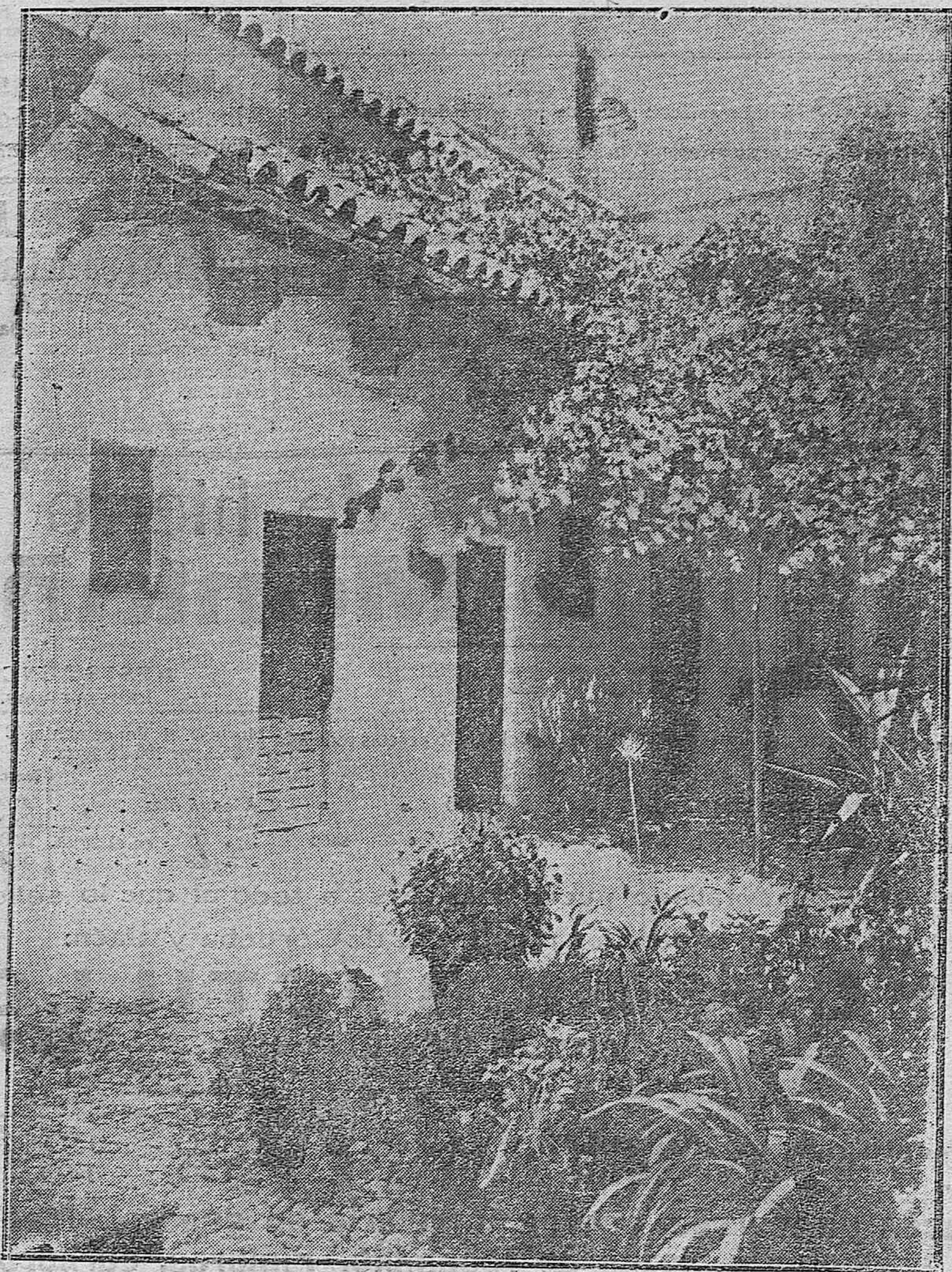
BELLO RINCÓN DE UN PATIO CORDOBÉS DE UNA CASA DE VECINOS.