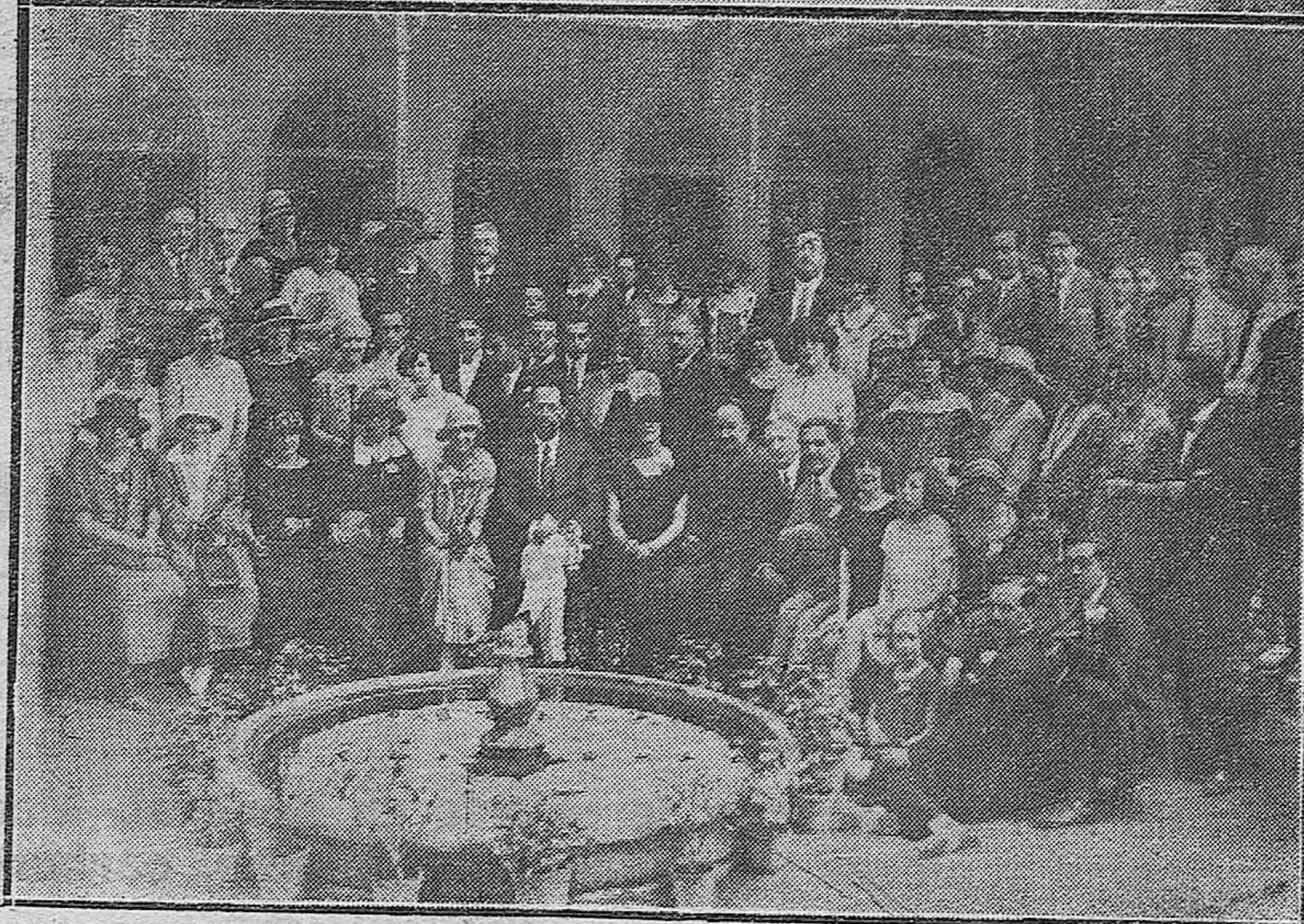
GRUPOS DE PROFESORES Y ALUMNOS DEL INSTITUTO DE LAS ESPANAS, DE NUEVA-YORK, QUE HAN VISITADO NUESTRA CAPITAL.