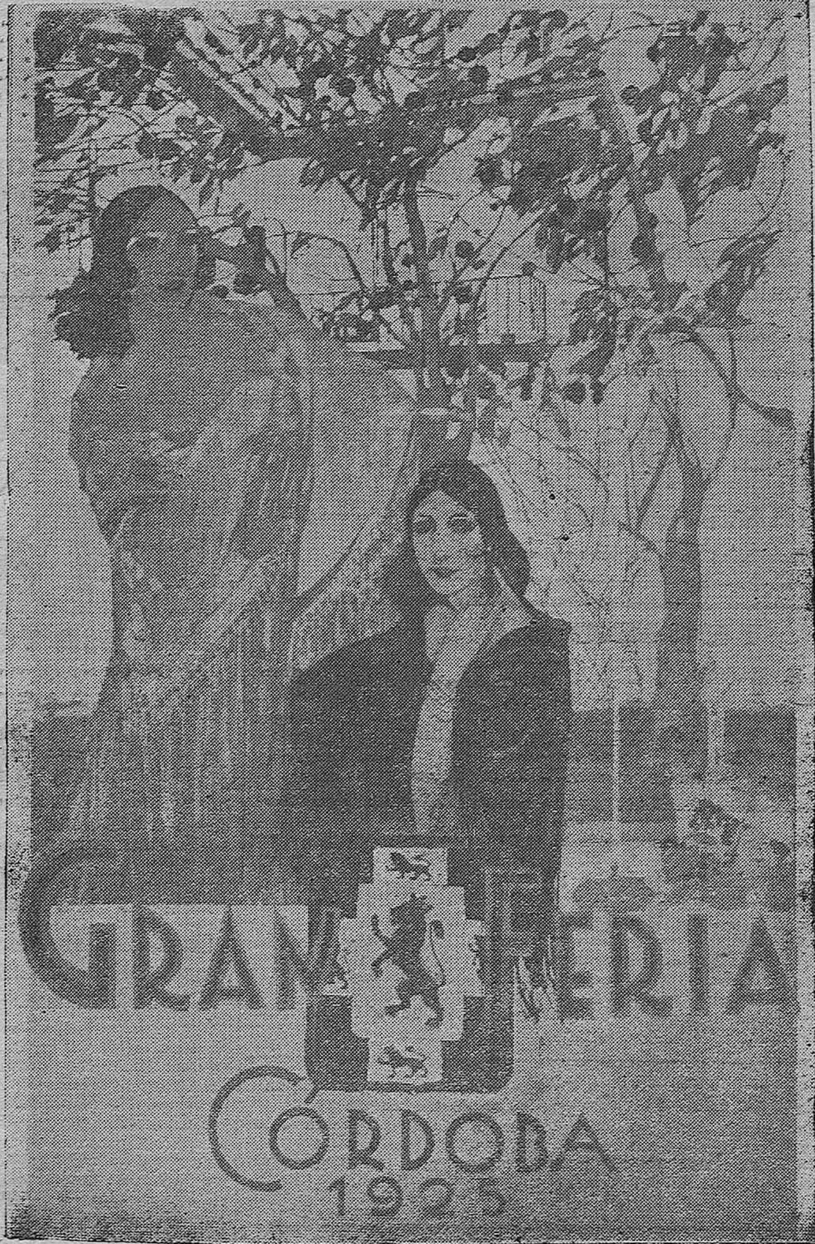
LA FERIA DE CÓRDOBA.--Notable boceto para cartel de nuestra Feria, original del notable artista Aristo-Tellez, que ha sido entregado hoy al Ayuntamiento.