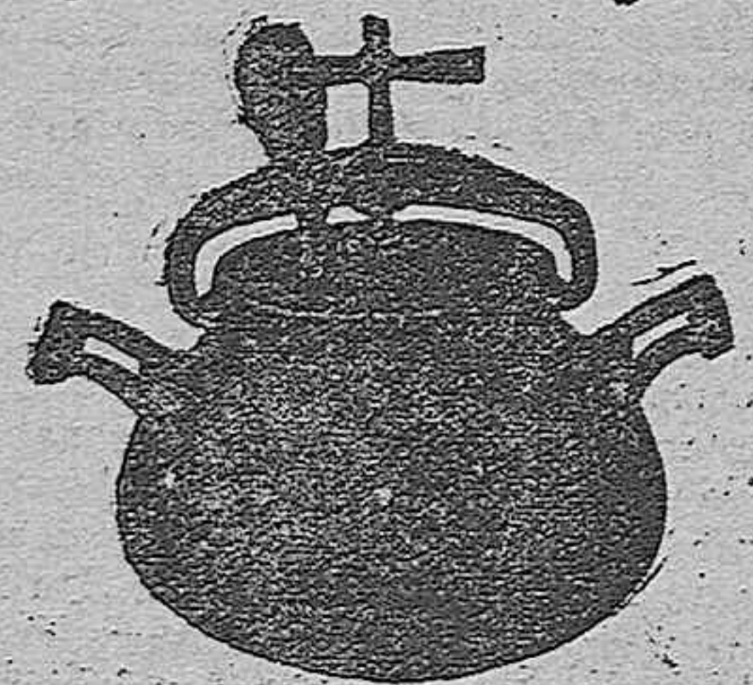
Marmita Hispano-Olla Express

Batería de cocina - Herrajes para obras y herramientas en general