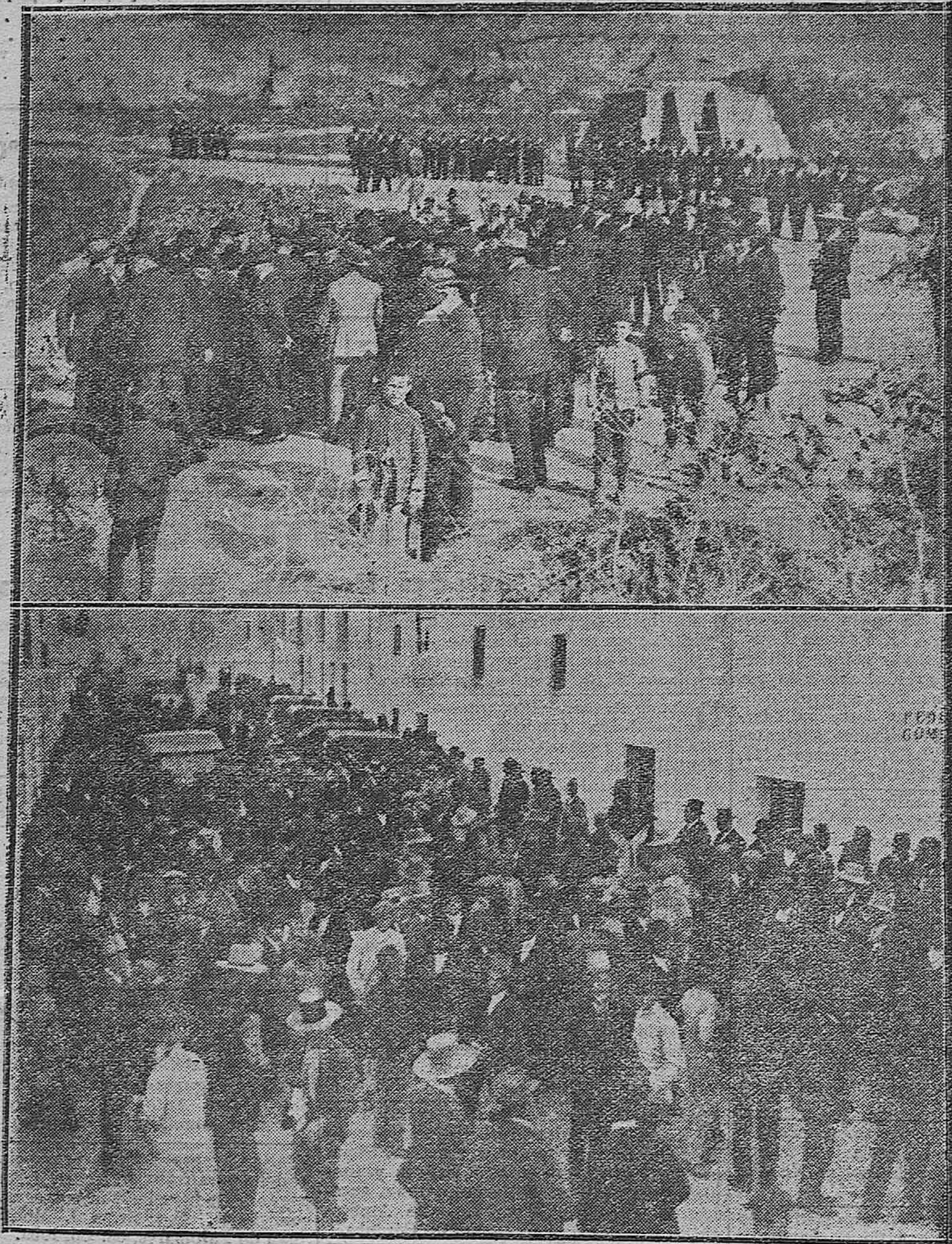
EL MITIN AGRARIO DE FERNAN-NUNEZ. -1) Las comisiones de los distintos pueblos que en el lugar denominado Los Tejares, esperaban a los oradores. -2) Aspecto de la calle José Canalejas a la terminación del mitin.