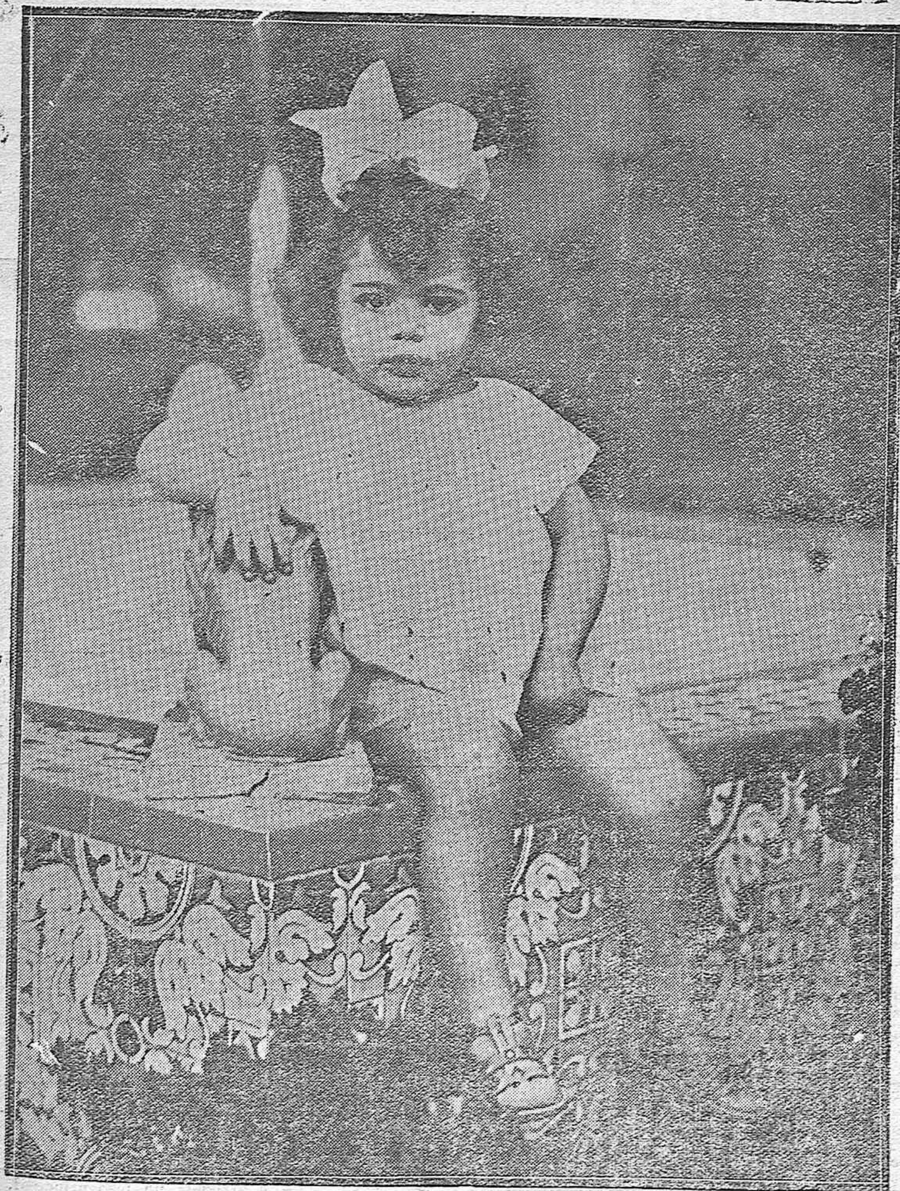
LOS NIÑOS DE CORDOBA.--Una encantadora y asida concurrente a los Jardines de la Agricultura, posando ante el objetivo de nuestro fotografo, en la fuente de los leones.