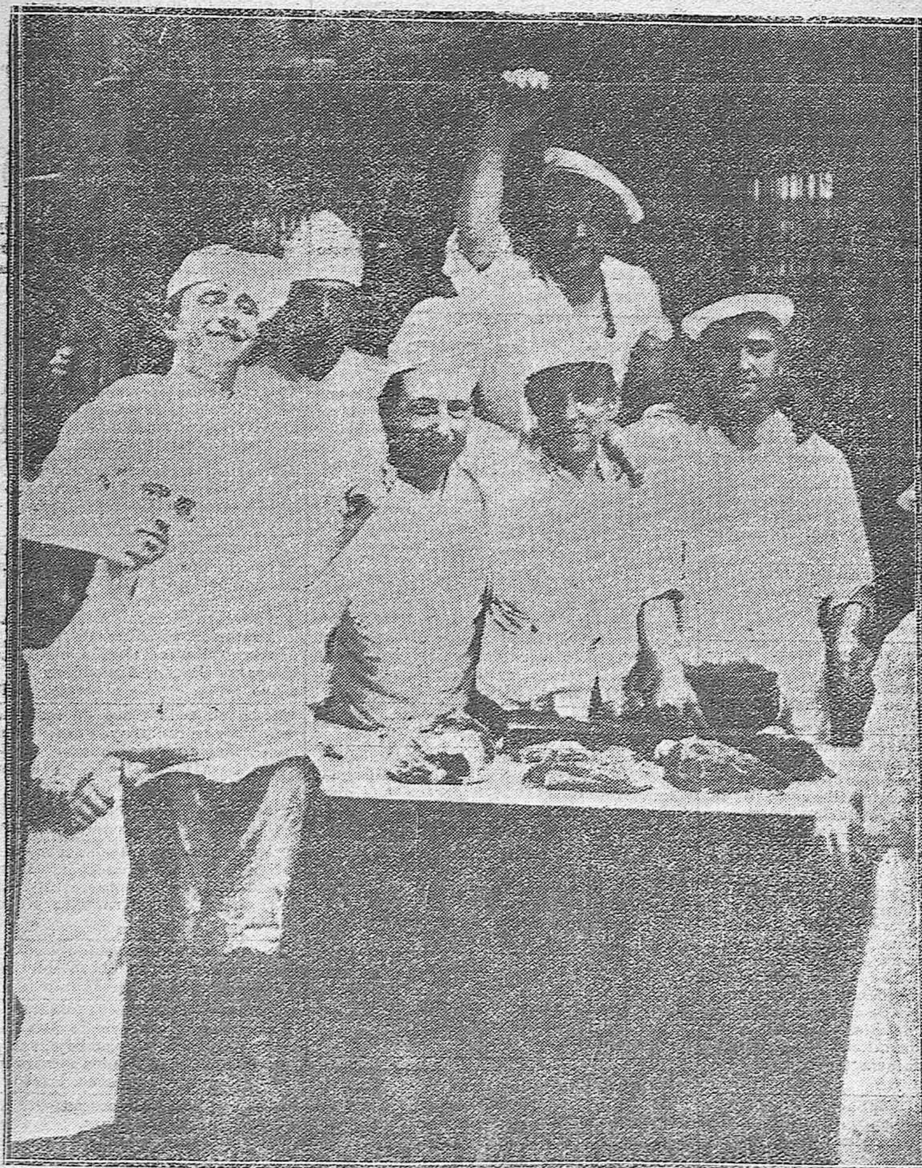
Grupo de carniceros del mercado central, luciendo los caprichosos gorros que les han sido impuestos por la comisión municipal de Abastos y Mercados.