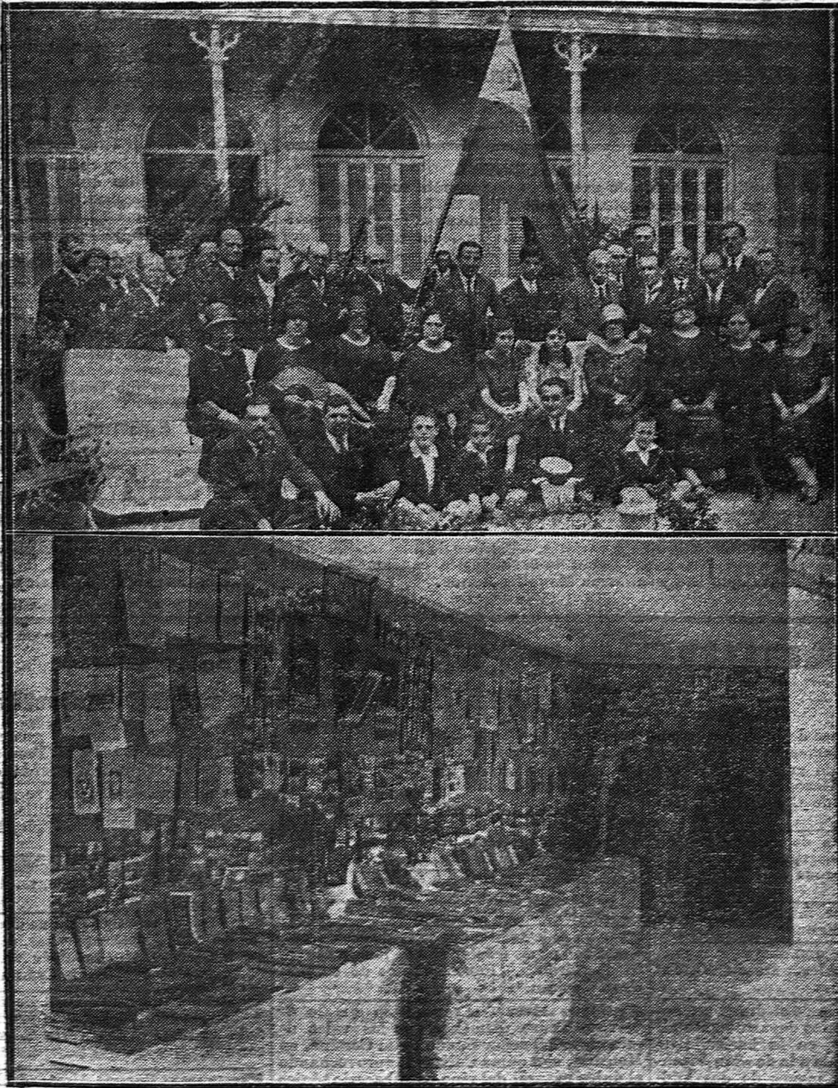
1) Grupo de esperantistas que han visitado nuestra capital. - 2) Exposición de obras esperantistas instalada en el Círculo de la Amistad.