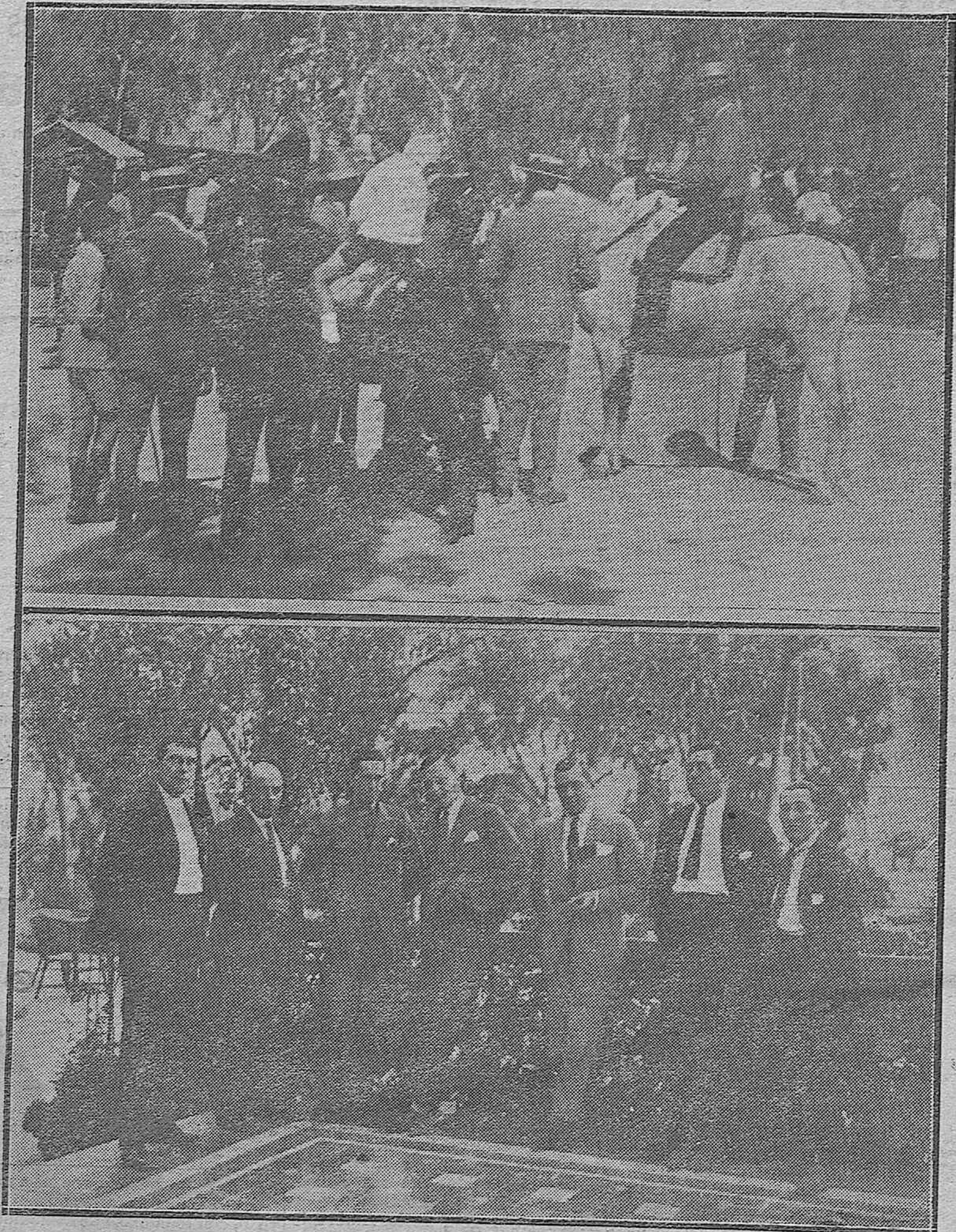
NOTAS DE FERIA.--1) El famoso extorero «Guerrita», con su nieto Pepito, recorriendo el mercado de ganados.--2) El caballero portugués don Ruy da Camara en la terraza del Regina, rodeado de sus amigos y admiradores.