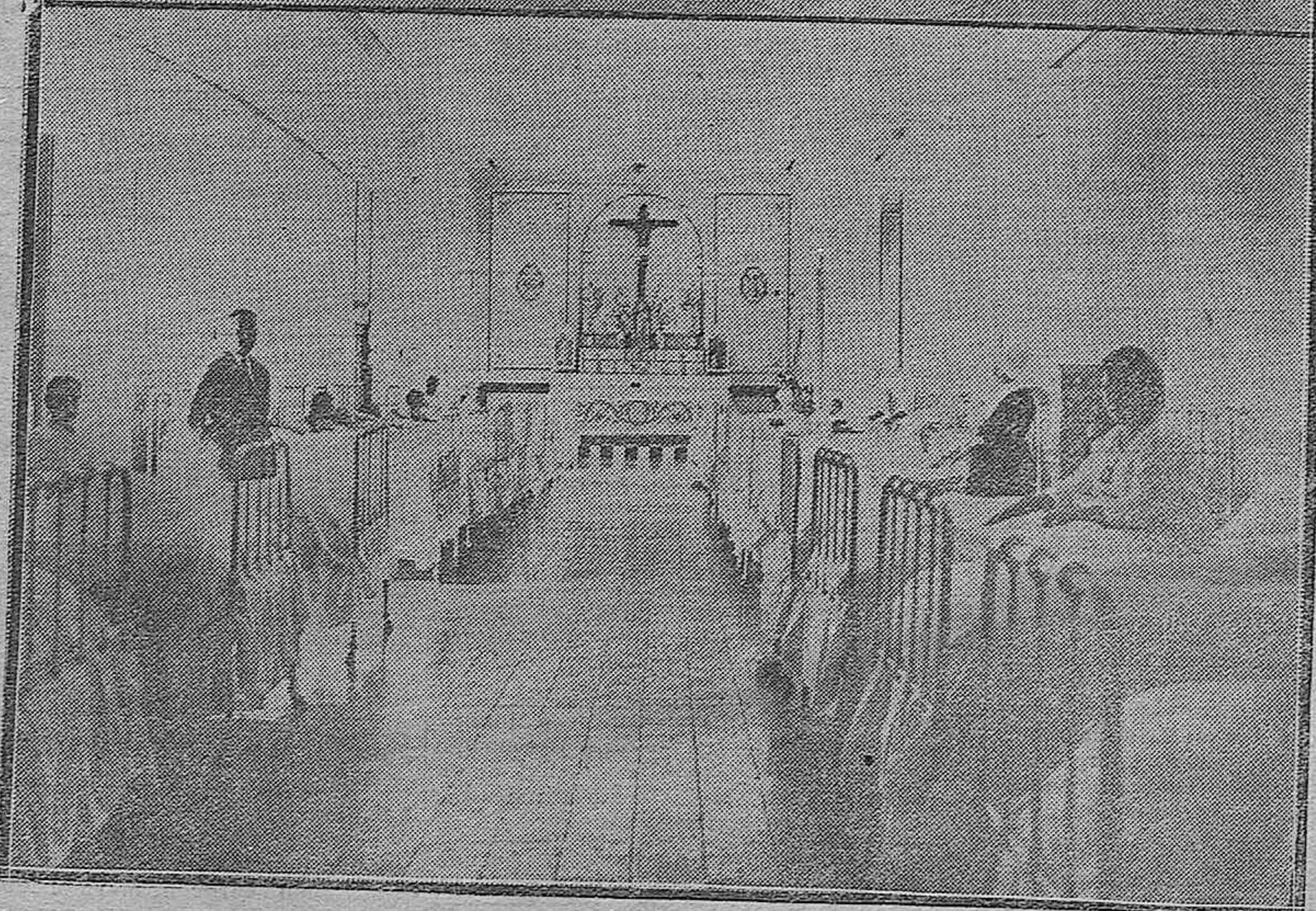
EL HOSPITAL GENERAL DE AGUDOS.--1) Los doctores Navarro y Alfólaguirre, practicando una operación en el quirófano.--2) Vista de una de las magníficas salas del benéfico establecimiento.