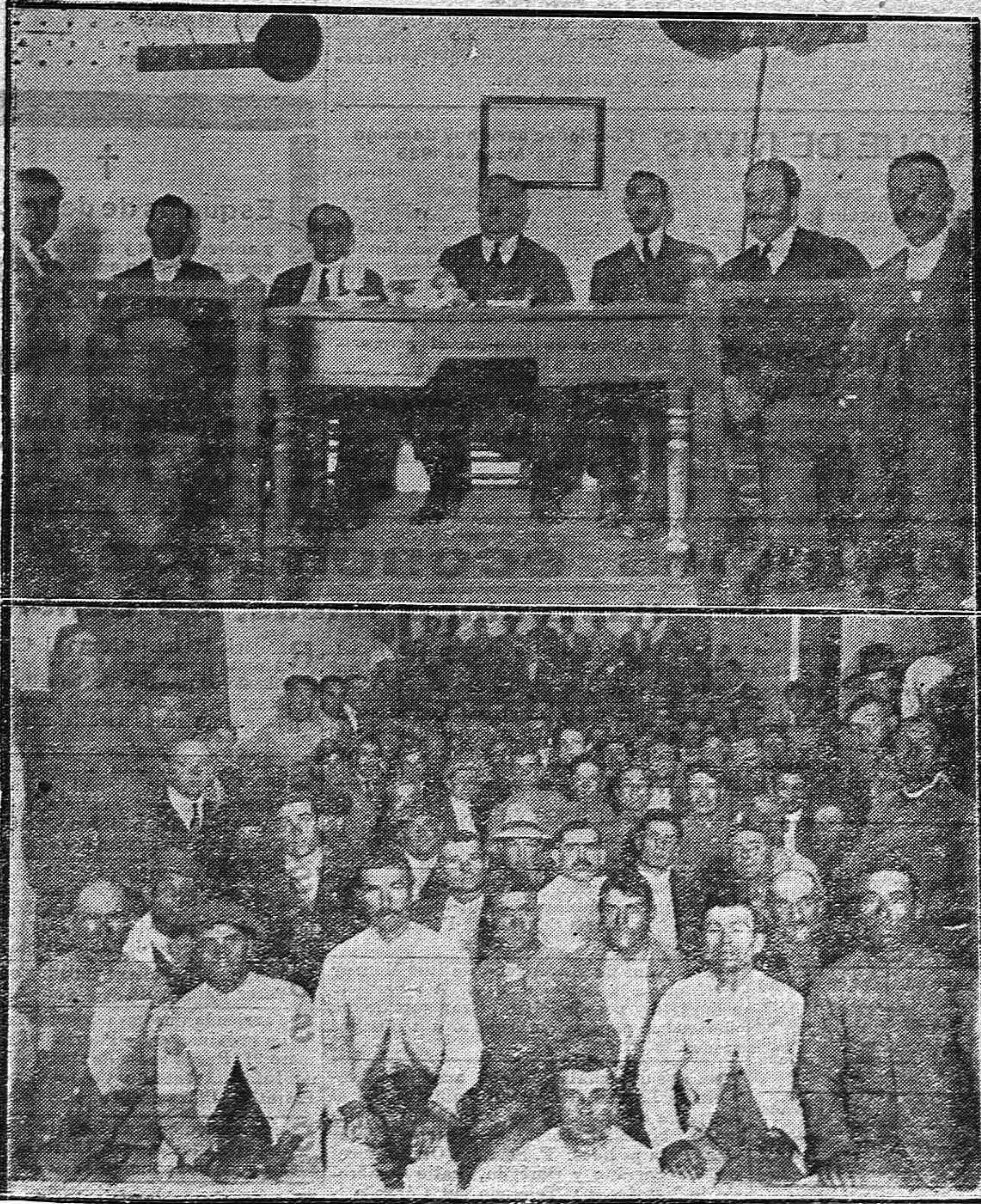
EL PRIMERO DE MAYO EN CÓRDOBA. --1) Presidencia de la fiesta conmemorativa del 1.º de Mayo en la Casa del Pueblo.--2) Grupo de asistentes al acto conmemorativo de la Fiesta del Trabajo.