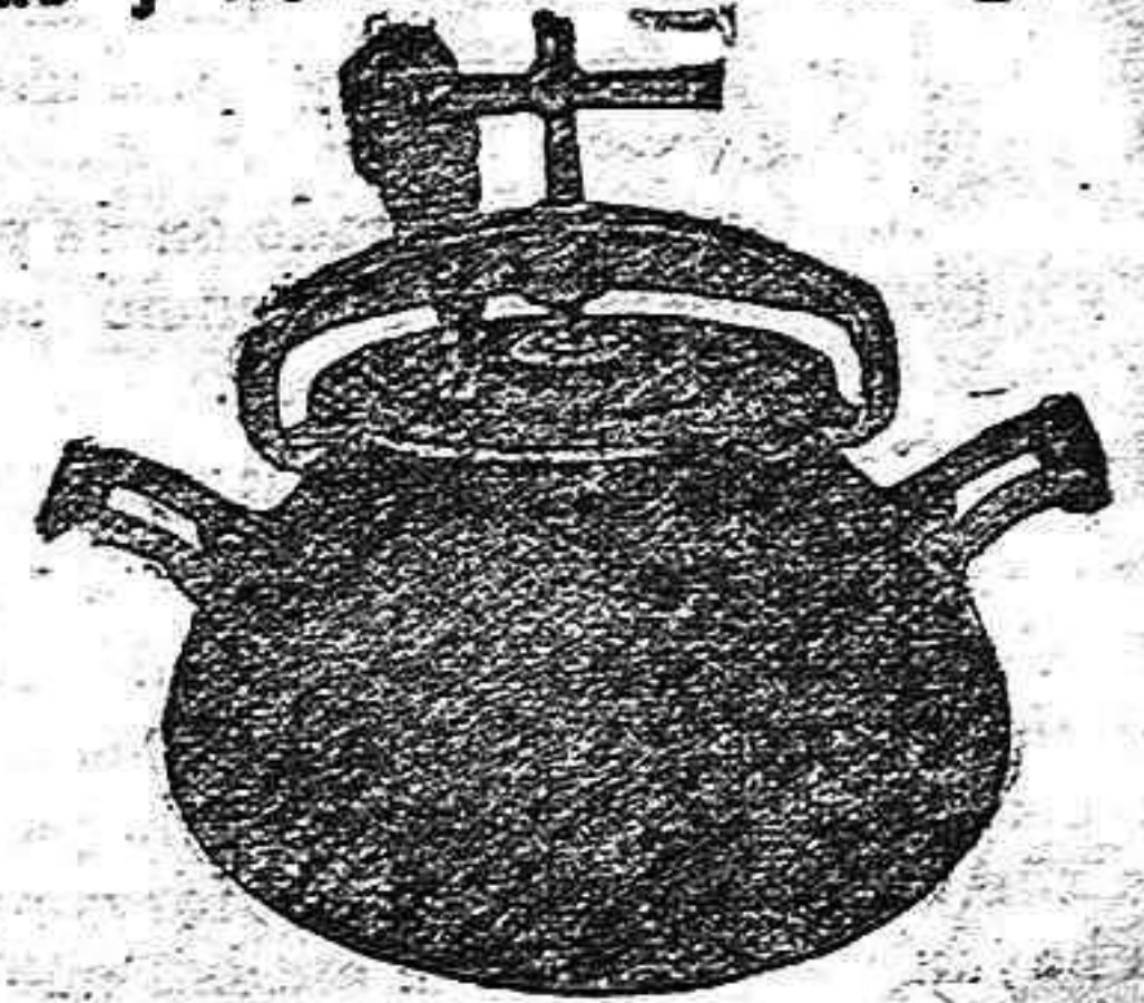
Marmita Hispano-Olla Expres.

Batería de cocina - Herrajes para obras y herramientas en general