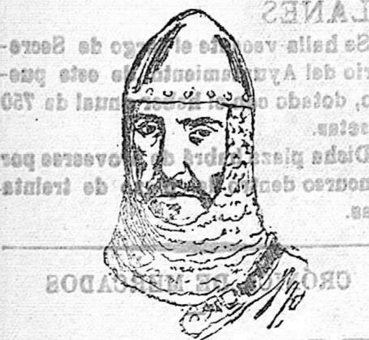
GUZMAN EL BUENO

Guzmán el Bueno, ó D. Alfonso Pérez de Guzmán, aquel que sacrificó á su primogénito antes que sacrificar á su honor, era hijo natural del adelantado de Andalucía, del mismo nombre y apellido. Dedicóle su padre á la carrera de las armas, y desde muy joven comenzó á distinguirse, por su valor y bizarría, en acciones de guerra y en torneos, cobrando con ello fama de valiente y gallardo, por lo que Alfonso «el Sabio» mostró deseos de conocerle. Un hermano del joven guerrero fué el encargado de presentarlo al Monarca, y como el hijo legítimo del Adelantado aludiera de un modo mortificante al nacimiento del natural, y el Rey asintiera á lo dicho por aquél, el ofendido dió enérgicas muestras de su enojo y se «desnaturalizó», marchando inmediatamente á ofrecer su brazo y su espada al emperador de Marruecos, quien le dispensó excelente acogida.