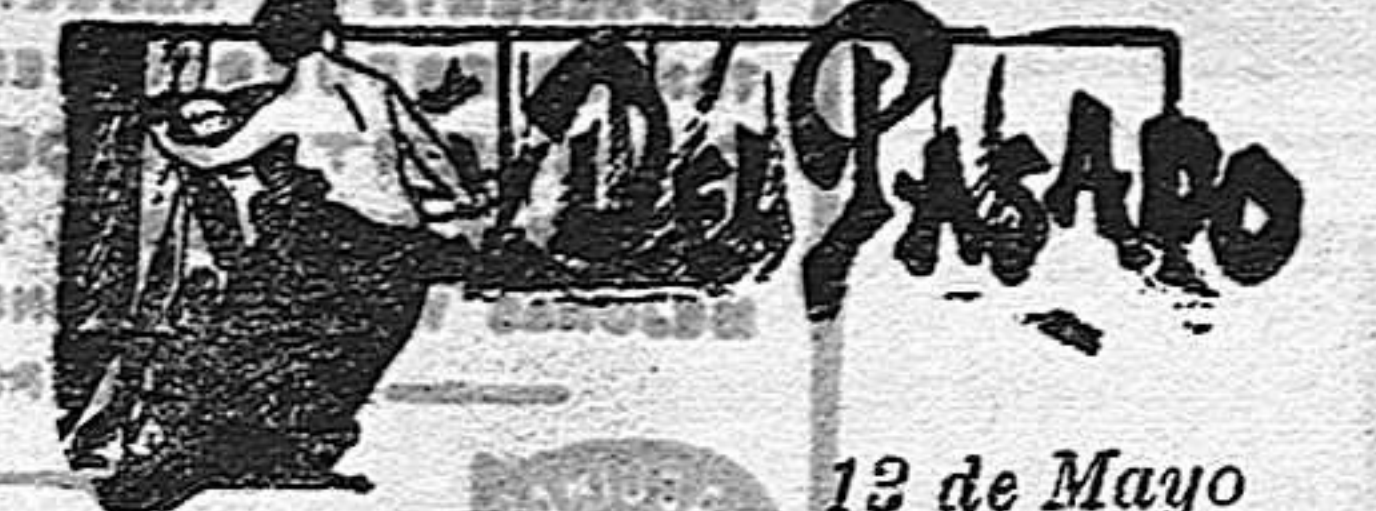
13 de Mayo

En tiempos de absolutismo le llamábamos á esto tiranía, hoy se llama democracia. Decididamente no es esta la llamada á borrar los viejos prejuicios.