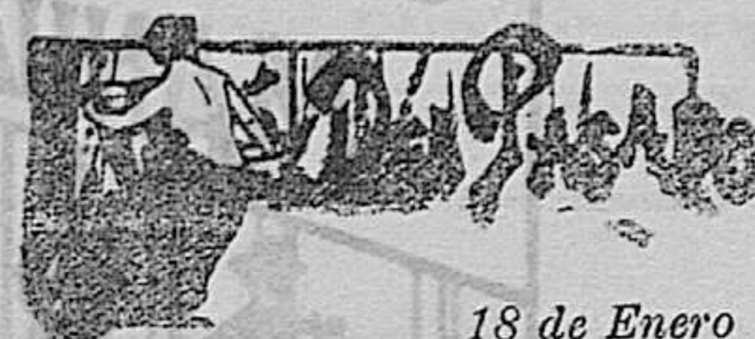
18 de Enero