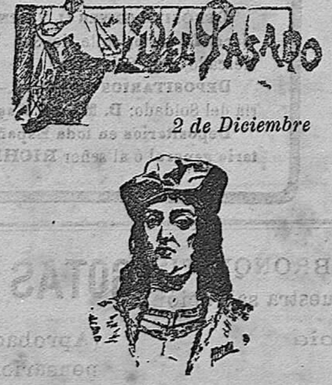
EL GRAN CAPITÁN

Imposible reseñar, ni aun á la ligera, los principales hechos de la vida del guerrero español que sus contemporáneos honraron con el dictado de «Gran Capitán», nacido en Montilla (Córdoba), el 16 de Marzo de 1456, y muerto, víctima de traiciones calenturanas, el 2 de Diciembre de 1515 en la ciudad de Granada; pues fueron tantos, todos tan grandes y tan meritorios, que en su descripción se han invertido numerosas páginas de gruesos volúmenes, razón por la que un ligero extracto haríamos ocupar mayor espacio que el destinado á estos «apuntes». Era seguidón de una noble e ilustre familia, y como la mayoría de los nobles de aquellos tiempos, se dedicó al ejercicio de las armas y fué el más gallardo, generoso, valiente, coraje, astuto, desolador, prudente y triunfante soldado de la corte de Isabel la Católica. Comenzó á dar pruebas de su destreza en el manejo de las armas y de sus grandes aptitudes para el mando de tropas en la conquista de Granada,