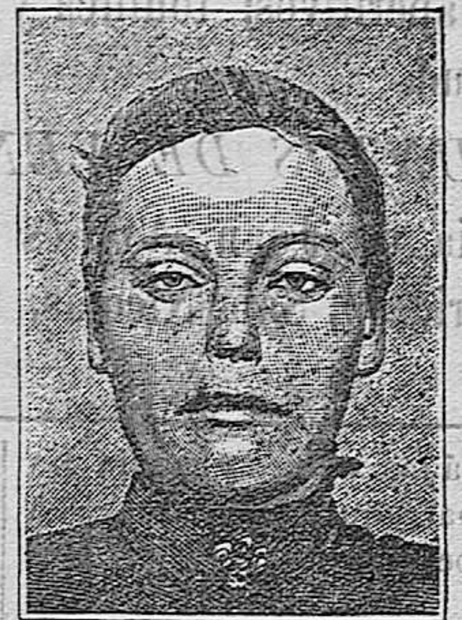
Después de 15 días de tratamiento